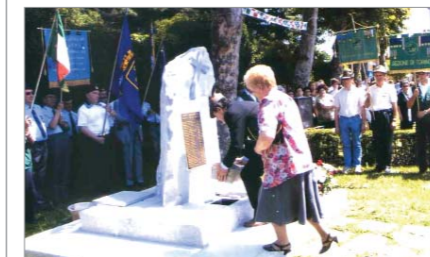
Domenica 14 giugno: partecipazione del Gruppo "MOVV Alberto Banfi", nella città di Feletto, alla inaugurazione del Cippo dedicato ai Caduti Senza Croce

Una delegazione del Gruppo, unitamente a Soci dei Gruppi di Ivrea e Venaria Reale , è intervenuta al XXVI Raduno Nazionale Artiglieri d'Italia che si è tenuto a Rivarolo Canavese - cerimonia nel Parco del Castello e defilamento.