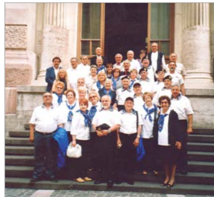
Soci, Patronesse e familiari del Gruppo durante una recente visita al Palazzo Marina (Ministero Difesa Marina) a Roma