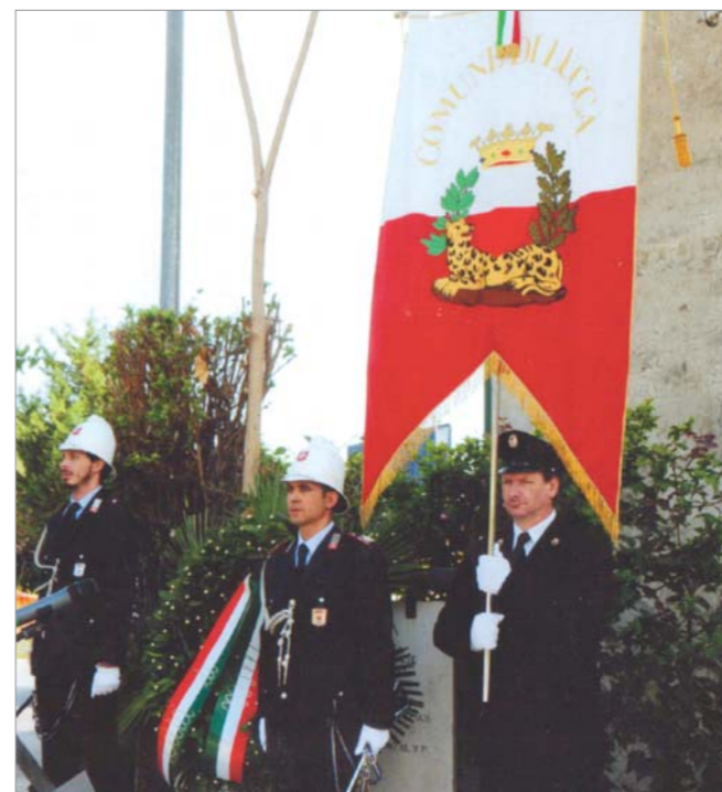
Due particolari della cerimonia