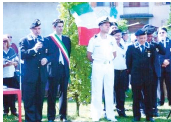
Particolare mentre parla il Presidente Nazionale