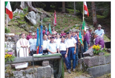
Partecipazione del Gruppo "Giovanni Bosio" alla cerimonia commemorativa dei Caduti nella grande guerra svolta nella Chiesetta sul Monte Cauriol "Campigol de Fer"