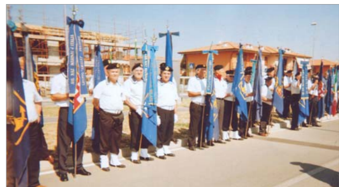
Lo schieramento dei Vessilli ANMI