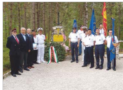
Foto ricordo al Cippo commemorativo