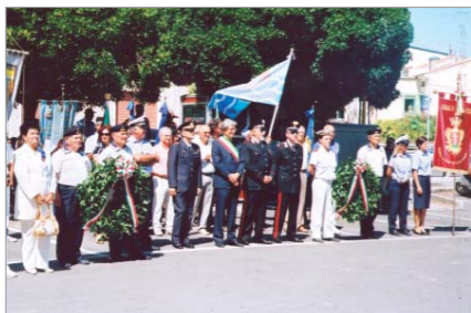
Un momento della cerimonia al monumento ai Caduti del Mare