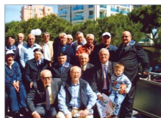
Foto ricordo del 9° Raduno Segnalatori Corso 1951 che si è svolto a Rimini dal 30 maggio al 6 giugno