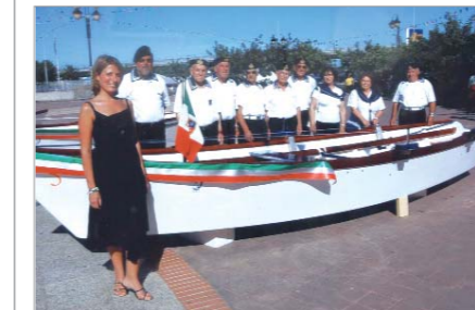
Il "chiatino" armato dai Marinai del Gruppo

Soci del Gruppo "MAVM Salvatorico Fera" hanno partecipato al Palio di Sas Carreras, (regata storica con chiatini dei rioni olbiesi) gareggiando con il rione Sacro Cuore ed ottenendo un onorevole piazzamento.