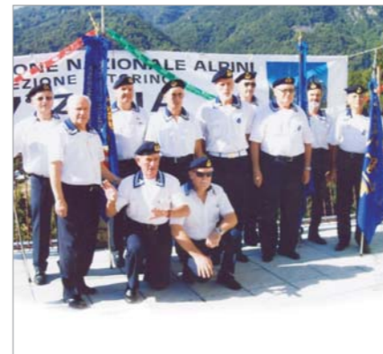
Parte delle rappresentanze dei Gruppi di Cuorné, Rivoli, Torino, Venaria Reale intervenute alla cerimonia per l'86° anniversario della Fondazione del Gruppo A.N. Alpini di Viù