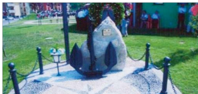
Il monumento inaugurato