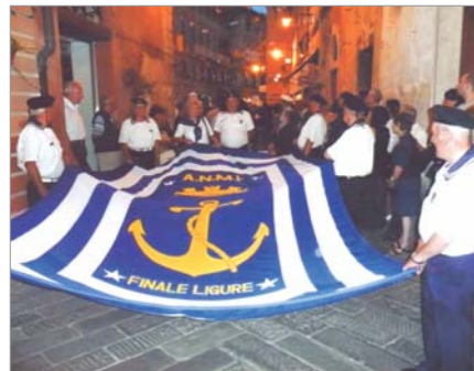
Domenica 16 agosto: un momento della presenza del Gruppo per le vie della città in occasione della Festa del Solino Azzurro