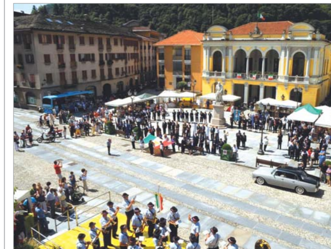
Parziale panoramica del luogo della cerimonia