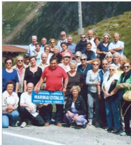
La gita sociale (23 e 24 luglio) a Livigno e Saint Moritz