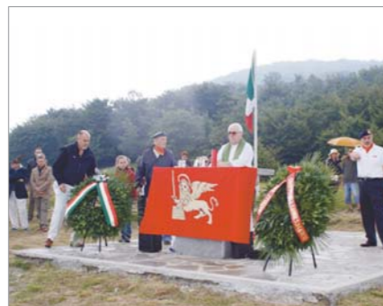
Un momento durante la funzione religiosa

Una rappresentanza di Soci della Sezione di Cairo Montenotte , Aggregata al Gruppo "STV Vanni Folco", ha partecipato, domenica 12 luglio, alla cerimonia commemorativa dei 200 Marò del Battaglione San Marco uccisi "ad armi rese" sul Monte Manfrei.