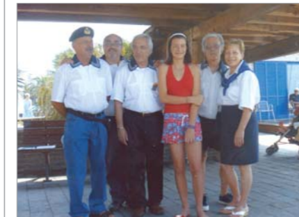
Componenti del Comitato organizzatore