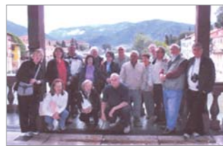
Foto ricordo sul famoso Ponte di Bassano

• I "Triodi" - Corso ETE 1955/1957 hanno tenuto, a giugno, il loro 5° Raduno a Bassano del Grappa. Sono state effettuate escursioni sul Monte Grappa, a Vicenza ed a Possagno (visita alla Casa Museo di Canova).