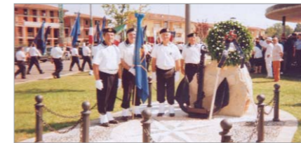
Soci del Gruppo intervenuti a Palosco all'inaugurazione del monumento ai Marinai d'Italia