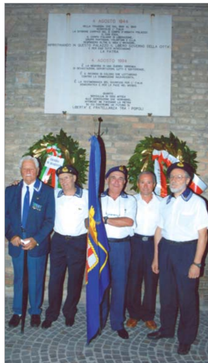
La rappresentanza del Gruppo "T.V. Licio Visintini MOVVM" intervenuta alla cerimonia per la ricorrenza dell'avvenuta liberazione della città il 4 agosto 1944