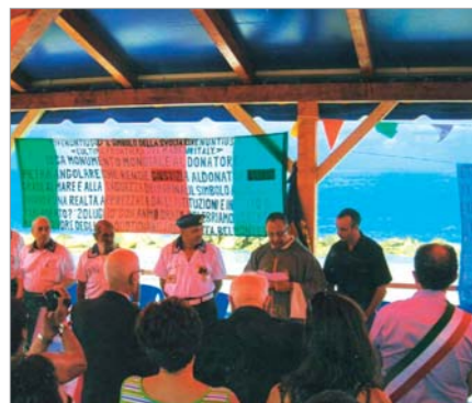
Particolare della cerimonia