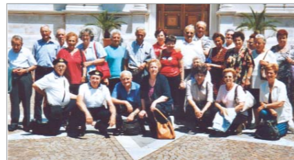
Dal 26 agosto al 2 settembre a Padova, Bassano del Grappa e Lago di Garda