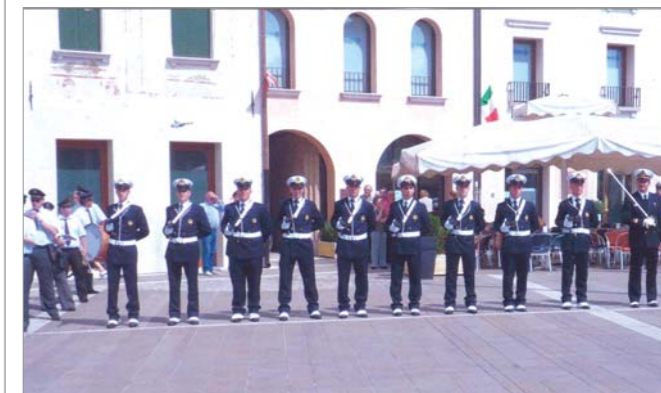
Il Picchetto di Allievi del "Morosini"