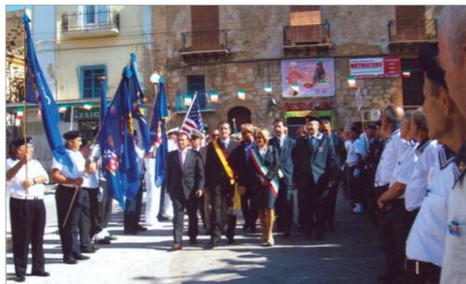
Due particolari della manifestazione