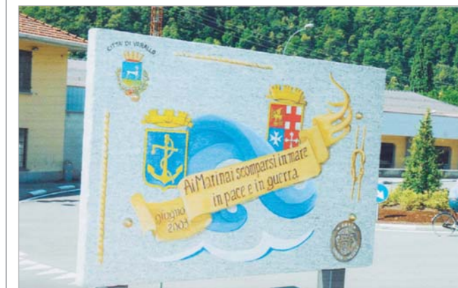
La Lapide inaugurata