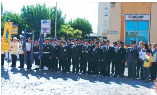
Due parziali panoramiche dello schieramento dei Reparti