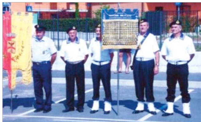
Il Medagliere della Marina – Alfieri e scorta del Gruppo di Paloscolo S. O.