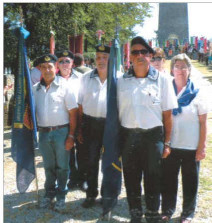
Le rappresentanze dei Gruppi "Aladino Neri" (Seravezza) e "Gaetano e Mauro Tavoni" (Massa) intervenute alle cerimonia commemorativa dell'eccidio di Sant'Anna di Stazzema avvenuto il 12 agosto 1944