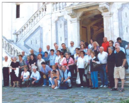
Una recente visita alla Certosa di Calci (PI)

Soci e familiari del Gruppo "MAVM Giuseppe Zoletti" hanno visitato Nave Cavour a La Spezia (30 giugno) ed inoltre hanno effettuato: