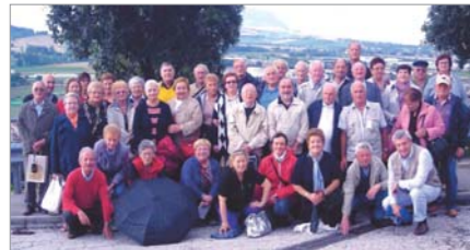
Soci e familiari del Gruppo "C.F. Felice Masini MAVM" che hanno partecipato alla gita sociale nelle Marche. Di particolare interesse l'incontro e lo scambio di crest con il Gruppo di Porto San Giorgio