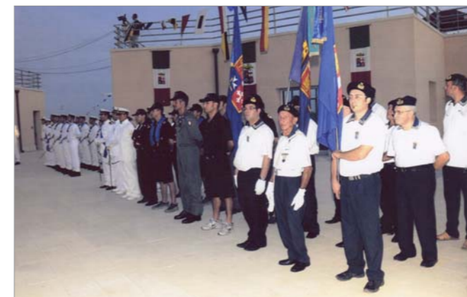
Parziale panoramica dello schieramento

Per l'ANMI i Gruppi di Ragusa, Scicli e Vittoria .