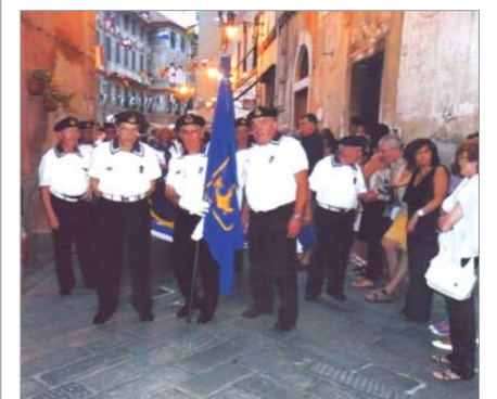
La rappresentanza del Gruppo "MAVM Com.te Augusto Migliorini" intervenuta il 29 giugno alla processione in onore di S. Pietro Protettore dei Pescatori