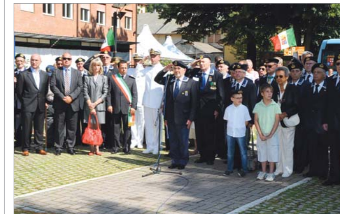
Un momento della cerimonia