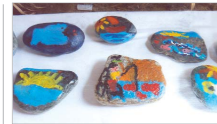
Alcuni "ciottoli colorati"