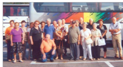
Nel mese di luglio ad Arenzano e Finale Ligure

Soci e familiari del Gruppo "Carlo Unger di Löwenberg e Silvio Fellner" durante le gite effettuate: