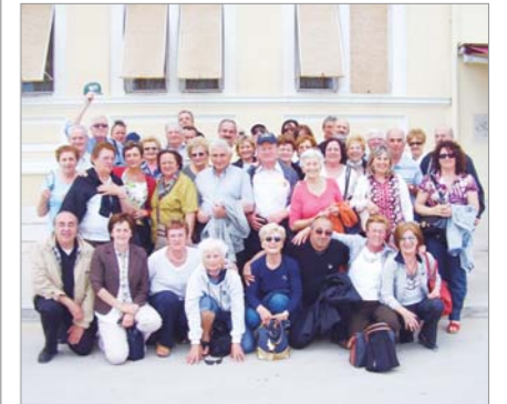
I partecipanti del Gruppo "Ondei – Ferraresi" alla gita sociale a Redipuglia, Trieste e in Croazia (Pola, isola di Brioni)