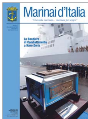
In copertina: Conferimento della Bandiera di Combattimento a Nave Andrea Doria