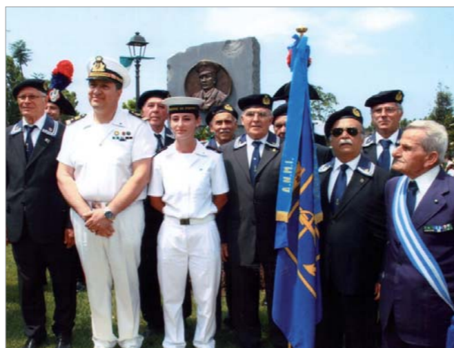
Un momento della cerimonia

Il 25 giugno è stato inaugurato il parco Comunale, intitolato a "Salvo D'Acquisto" MOVVM, con la partecipazione di una rappresentanza del gruppo di Torre del Greco.