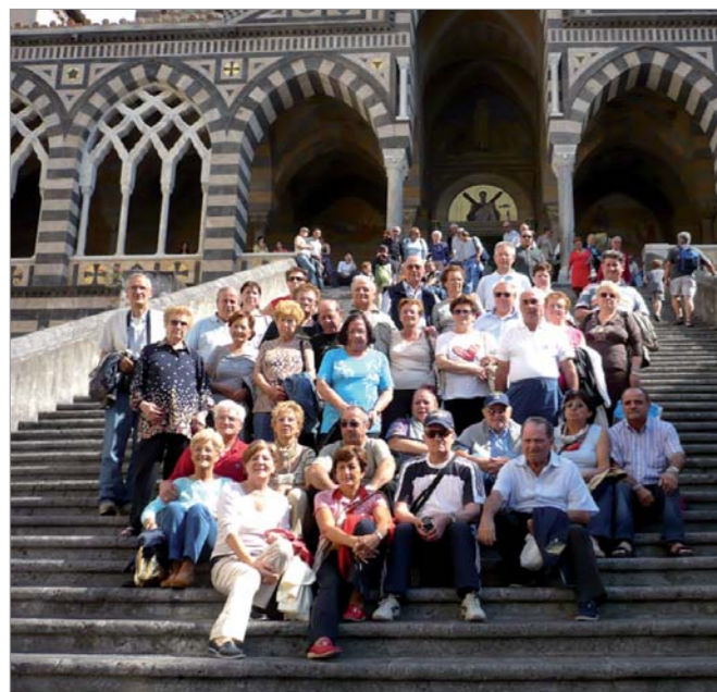
I partecipanti sulla scalinata del Duomo di Amalfi

Alcuni soci del gruppo ANMI di Ospitaletto ha effettuato una gita sulla costa Amalfitana.