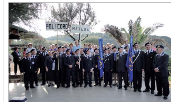
Le rappresentanze di Matera e di Policoro

In occasione del 18° Raduno Nazionale di Gaeta la rappresentanza del Gruppo, costituita da 50 persone tra cui 35 soci e 15 famigliari, ha visitato, dopo il defilamento, le parti più interessanti della città.