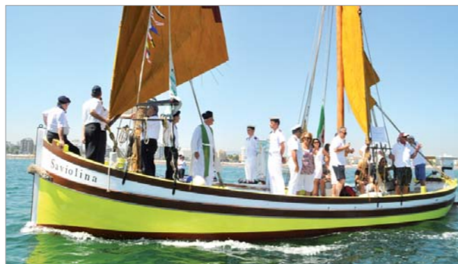
La barca Saviolina

Una delegazione ANMI di Riccione ha partecipato in divisa sociale alla cerimonia della Madonna del Mare.