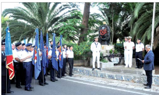
La rappresentanza davanti al Monumento ai Caduti

Con la partecipazione delle massime Autorità Militari, Civili e Religiose, questo Gruppo, ha festeggiato la Festa della Marina con la Santa Messa e la deposizione di una corona al Monumento ai Caduti del Mare.