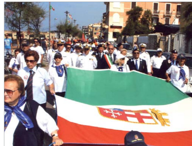
Un momento del defilamento delle delegazioni nelle vie cittadine

Festa della Marina Militare avvenuta il 19 giugno a Ladispoli. Alla manifestazione ha partecipato il gruppo ANMI di Ladispoli, il sindaco della città, il Consigliere Regionale del Lazio, ammiraglio Attilio Gambino e molte Autorità cittadine e rappresentanze delle varie Associazioni d'arma.