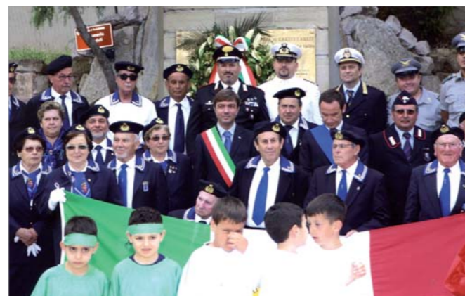
Foto di gruppo dei partecipanti