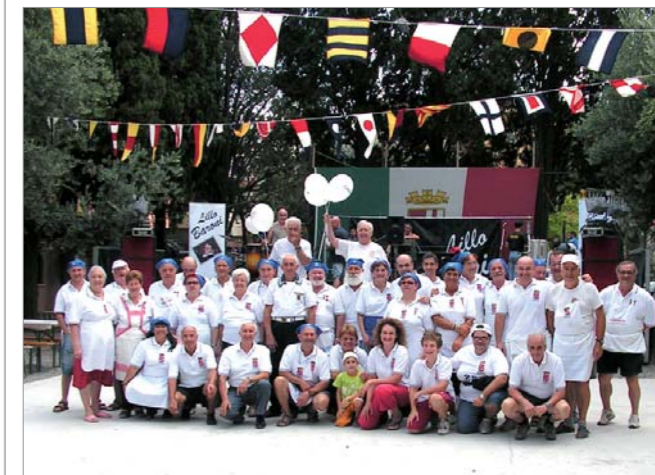
Un momento della della manifestazione

Nel periodo 12-14 agosto si è svolta la 29ª Sagra del mare con la partecipazione di molti soci e con la presenza del CN Liguria Pietro Pioppo.