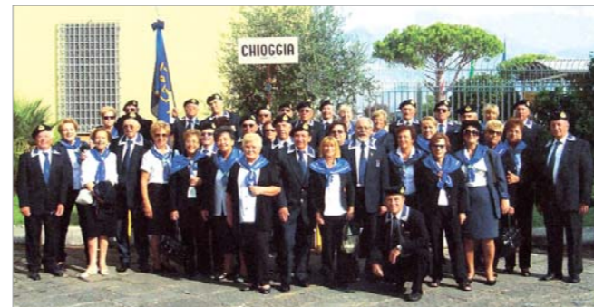
La rappresentanza dei soci e loro famigliari

Una numerosa rappresentanza del gruppo di Chioggia è intervenuta al 18° Raduno Nazionale di Gaeta.