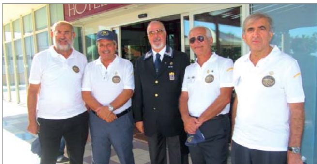
Il Presidente Nazionale con alcuni dei soci che sono stati imbarcati sul Piomarta