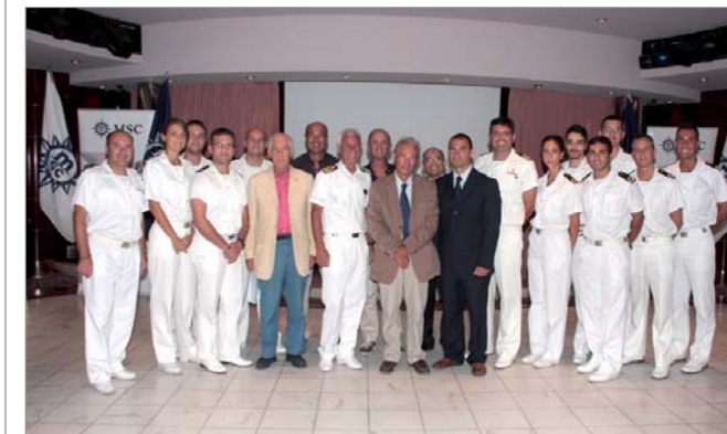
Il gruppo ANMI di Salerno ha partecipato al 18° Raduno Nazionale di Gaeta.