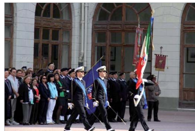
La rappresentanza al passaggio della Bandiera

Il cambio del Comandante dell'Accademia Navale, fra gli ammiraglio Rosati e Cavo Dragone, è stata un'occasione per il gruppo di Livorno per partecipare alla Manifestazione. Si rappresenta che, un reparto dello schieramento della cerimonia era formato di soci di questo gruppo.