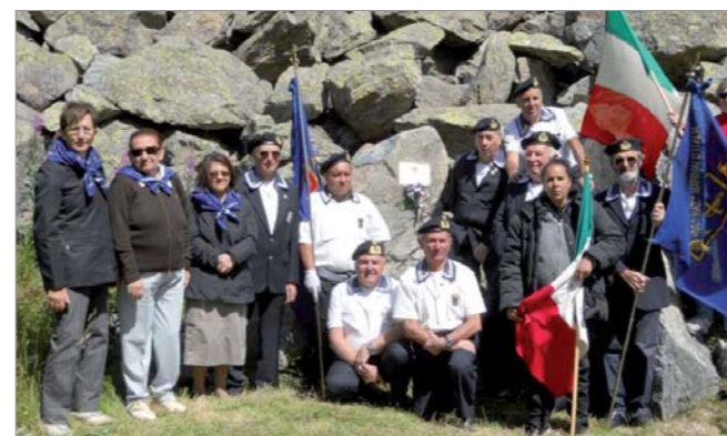
Un momento della cerimonia

Il 31 luglio 2011 delegazioni dei Gruppi "MOVM Alberto Banfi" di Cuornè e "CGVM Mario Cagnassone" di Venaria Reale sono intervenute alla manifestazione organizzata dall'Associazione Bersaglieri presso il Pian della Mussa. Nell'occasione è stata scoperta una targa dedicata ai soci scomparsi dei due gruppi.