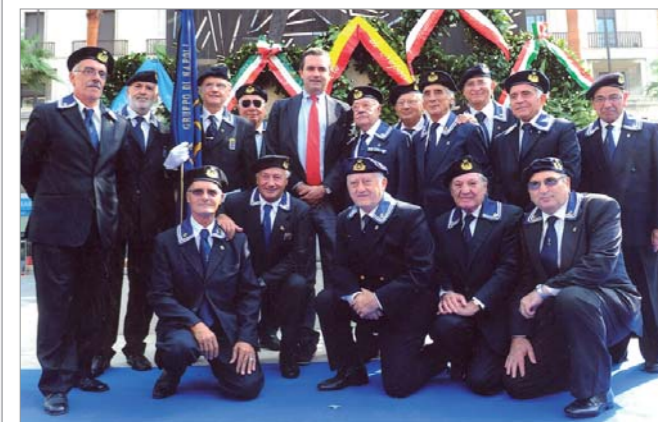
La rappresentanza con al centro il sindaco De Magistris

In occasione del 68° anniversario delle "4 Giornate di Napoli" il 28 settembre 2011 , si è svolta una cerimonia presso Stele sita in via C. Console, con deposizione di una corona da parte del sindaco di Napoli On. Luigi De Magistris. Sono intervenuti inoltre Autorità politiche, religiose e militari.