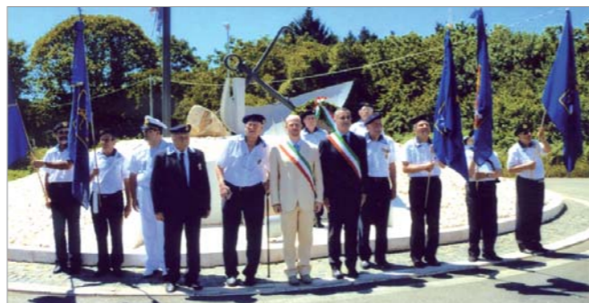
La deposizione di una corona al Monumento dei caduti del mare