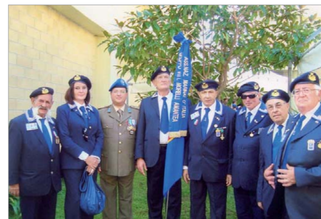
Il gruppo di Amantea ha partecipato al 18° Raduno Nazionale di Gaeta.