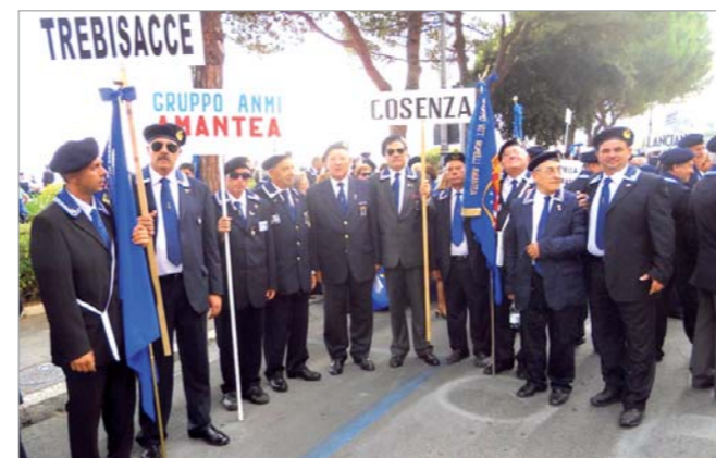
Nella foto la rappresentanza di Amantea con quelle di Trebisacce e Cosenza