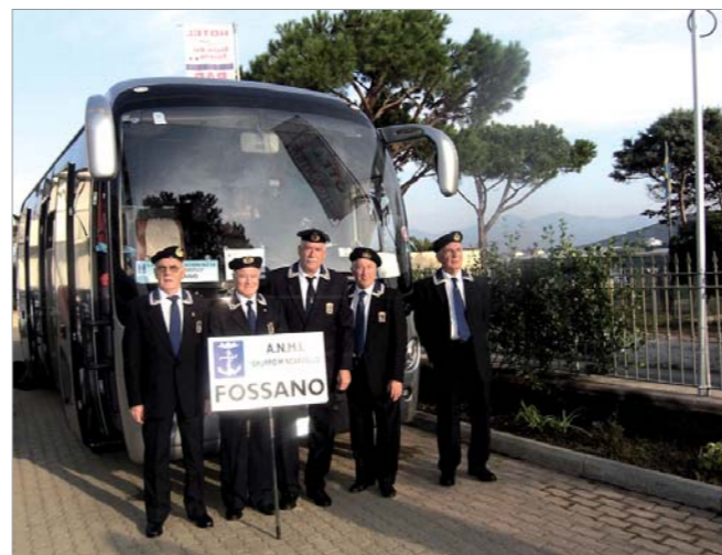
Una rappresentanza dei partecipanti davanti al pulman predisposto per il tour