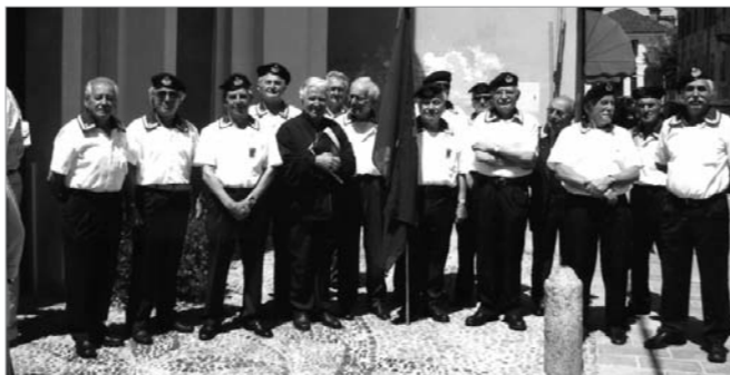
La rappresentanza del gruppo fotografata con al centro l'alfiere

Il gruppo ha celebrato la festa della Marina con la deposizione di una corona al monumento ai Caduti del Mare e una S. Messa.