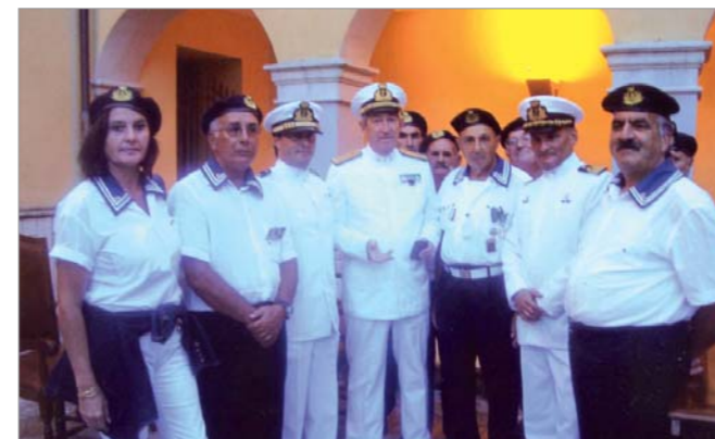
Un momento della cerimonia

L'8 settembre si è svolta la cerimonia della concessione della Cittadinanza Onoraria all'ammiraglio Ispettore Capo Marco Brusco, Comandante Generale delle Capitanerie di Porto, svoltasi presso il palazzo comunale di Fagnano Castello. Oltre ai soci, hanno partecipato anche autorità civili e militari e un grande numero di simpatizzanti.