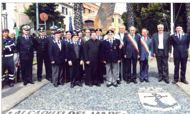
I soci e le patronesse davanti al Monumento ai Caduti di Gaeta

Una rappresentanza del gruppo di Diano Marina ha partecipato al 18° Raduno Nazionale di Gaeta.