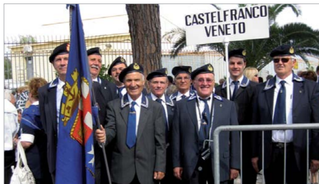
Le rappresentanze dei soci e delle patronesse con il presidente Nazionale ammiraglio Pagnottella