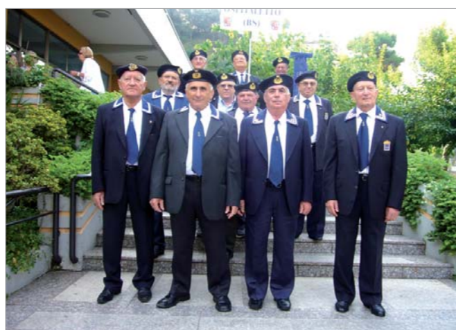
Rispettivamente il gruppo delle patronesse e dei soci