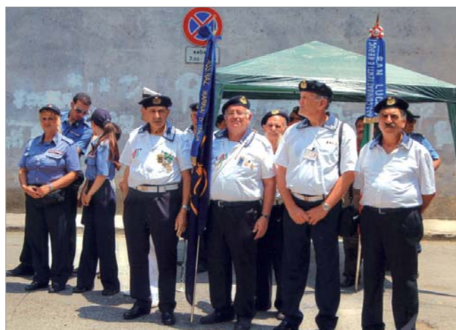
I partecipanti del gruppo di Amantea alla manifestazione

Erano presenti alla cerimonia il Vice Comandante dei Carabinieri di Paola, l'Associazione dell'Arma dei Carabinieri, la Giunta Comunale e l'Associazione Combattenti di San Lucido.