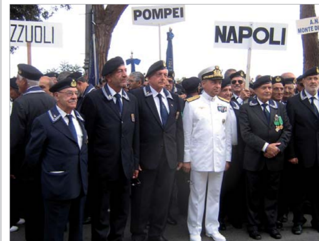
La rappresentanza fotografata al termine del defilamento

Una delegazione del gruppo ha partecipato al Raduno Nazionale di Gaeta.