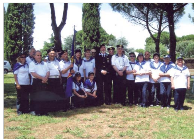
Nella foto la rappresentanza di San Benedetto del Tronto con al centro il Presidente Nazionale ammiraglio Paolo Pagnottella

Una rappresentanza del gruppo di San Benedetto del Tronto ha partecipato alla cerimonia della celebrazione del decennale della fondazione del gruppo di Civita Castellana.