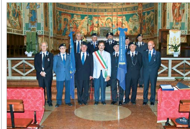
Nella foto con la rappresentanza si nota al centro il sindaco, all'estrema sinistra il presidente del gruppo di Vicenza e all'estrema destra il presidente del Gruppo di Padova

La cerimonia ha avuto inizio con la Santa Messa, in ricordo di tutti i Marinai d'Italia Caduti. Prima di eseguire la lettura della preghiera del Marinaio il presidente del gruppo di Vicenza ha donato al Sindaco, anche a nome del gruppo di Padova, una "Preghiera" incisa in un'artistica e decorata formella.