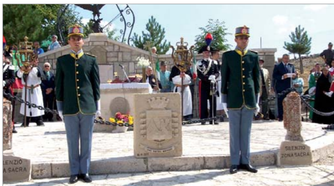
Un momento della cerimonia

Il 24 settembre è stata celebrata, presso il sacrario Nazionale Mauriziano a Pescocostanzo la 10ª Giornata Nazionale Mauriziana alla presenza delle rappresentanze dai decorati di Medaglia d'Oro Mauriziana Interforze e delle Associazioni Combattentistiche e d'Arma.