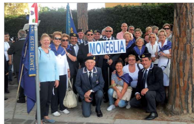
La rappresentanza di Moneglia

Numerose rappresentanze di Moneglia e di Sestri Levante hanno partecipato al 18° Raduno nazionale di Gaeta.