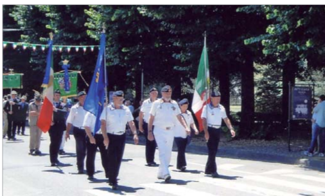
La rappresentanza del gruppo durante la sfilata

Al Raduno Regionale del gruppo Alpini di Borgo San Lorenzo nel mese di giugno 2011 ha partecipato una rappresentanza del gruppo di Firenze.