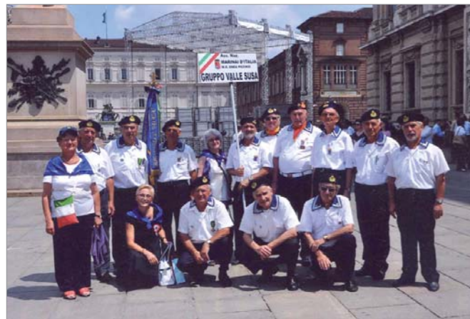
La rappresentanza del gruppo in piazza Castello dove è avventa l'ammaina Bandiera

Trentacinque associazioni d'arma hanno sfilato nel centro storico applauditi da circa 100.000 persone. La celebrazione ha visto la partecipazione di autorità militari, civili e religiose.