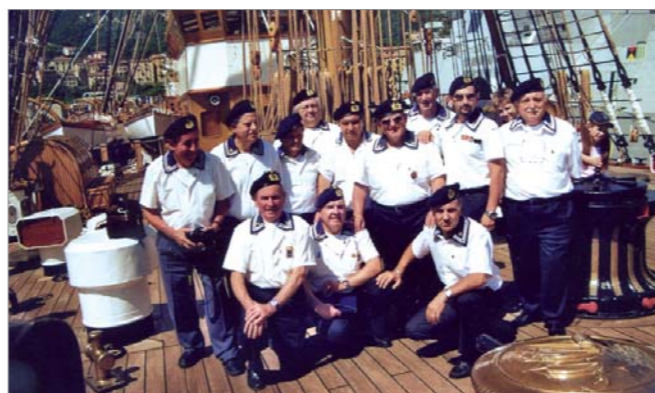
Un momento della visita sulla nave Vespucci

Il gruppo di Venaria Reale con un considerevole numero di soci, ha partecipato il 4 giugno, a una visita nell'Arsenale della Spezia e alla nave scuola Amerigo Vespucci . Tutti i partecipanti sono rimasti entusiasti soprattutto della visita sulla nave Vespucci .