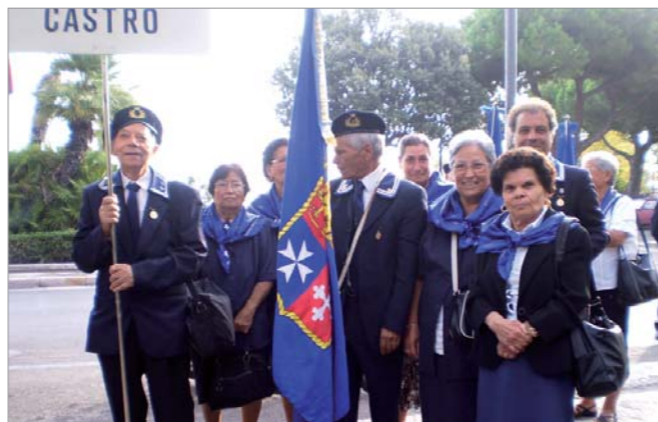
Una rappresentanza del gruppo

Il gruppo ANMI di Castro ha partecipato al 18° Raduno Nazionale di Gaeta.