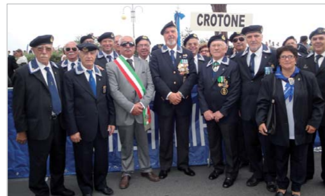
Nella foto la rappresentanza posa con il Presidente Nazionale ammiraglio Pagnottella

Una folla rappresentanza del Gruppo "di Crotone" ha partecipato nei giorni 24 e 25 settembre scorsi al 18° Raduno dell'ANMI tenutosi a Gaeta. Erano presenti al Raduno 46 tra soci e patronesse del Gruppo e della sezione aggregata di Cirò Marina. Con i marinai del gruppo, ha partecipato al defilamento, anche il vice sindaco del comune di Cirò, Amoruso.