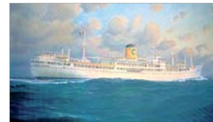
Stephen J Card - Andrea C - 1946/1982

Alle rotte Sudamericane vengono destinate la Andrea C e la Giovanna C . La Linea C inizia ad impiegare le navi per vere e proprie crociere e tra le prime crociere si ricordano quelle nel Mediterraneo della Andrea C nel 1952 e della Anna C nel 1953. Il varo di navi lussuose, dotate di aria condizionata nella prima e nella seconda classe e di ambienti confortevoli ed eleganti, un servizio impeccabile che prevede ospitalità, comfort e ricette della migliore tradizione mediterranea, contrassegnano l'indiscutibile stile italiano della compagnia. Stile che raggiunge il massimo della rappresentatività negli allestimenti, nell'arredamento e nelle linee architettoniche. Nel 1957 viene inaugurata la prima nave commissionata da Costa ai cantieri genovesi dell'Ansaldo, la Federico C , ancora suddivisa in tre classi, dotate di ristorante e piscine dalle forme ardite. Successivamente Bianca C , Enrico C , Andrea C , Flavia , Fulvia e Carla C vengono ristrutturare nell'ottica di offrire qualcosa di più di un semplice mezzo di trasporto. Nel 1959 la Costa realizza la prima nave al mondo completamente dedicata alle crociere di svago negli Stati Uniti e nei Caraibi: la Franca C , a cui viene affiancata nei mesi invernali la Anna C , che propone mini crociere per le Bahamas. Nei primi anni '60 alle rotte del Sud America o dei Caraibi si affiancano le crociere nel Mediterraneo, nel Mar Nero, in Brasile, Uruguay e Argentina, fino allo stretto di Magellano e all'Antartico.