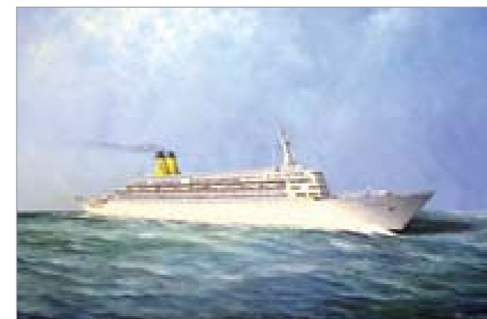
Renzo Pauletta – Eugenio C – 1966/1997