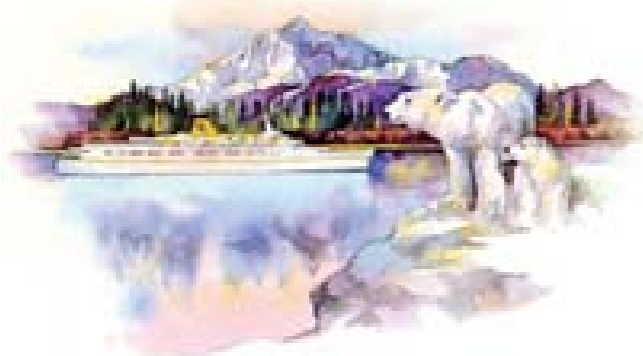
Costa Daphne – 1975/1996 – Nella crociera polare