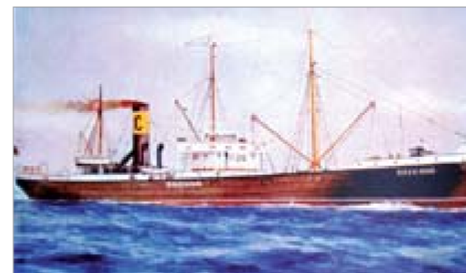
La nave Ravenna (1924/1933) stazza lorda 1.148 tons.

Nasce la Costa Armatori S.p.A., che nel 1947 estende il settore della navigazione al trasporto passeggeri. Il 31 marzo 1948 parte da Genova la Anna C prima nave passeggeri della flotta Costa, prima ad attraversare l'Atlantico meridionale dalla fine del conflitto e capace di offrire ai passeggeri cabine con aria condizionata. I servizi commerciali verso l'America del Nord sono, invece, inaugurati nel 1948 con la nave Maria C , affiancata dalla Luisa C , mentre nel 1953 Franca C apre nuove rotte verso il Venezuela e le Antille.