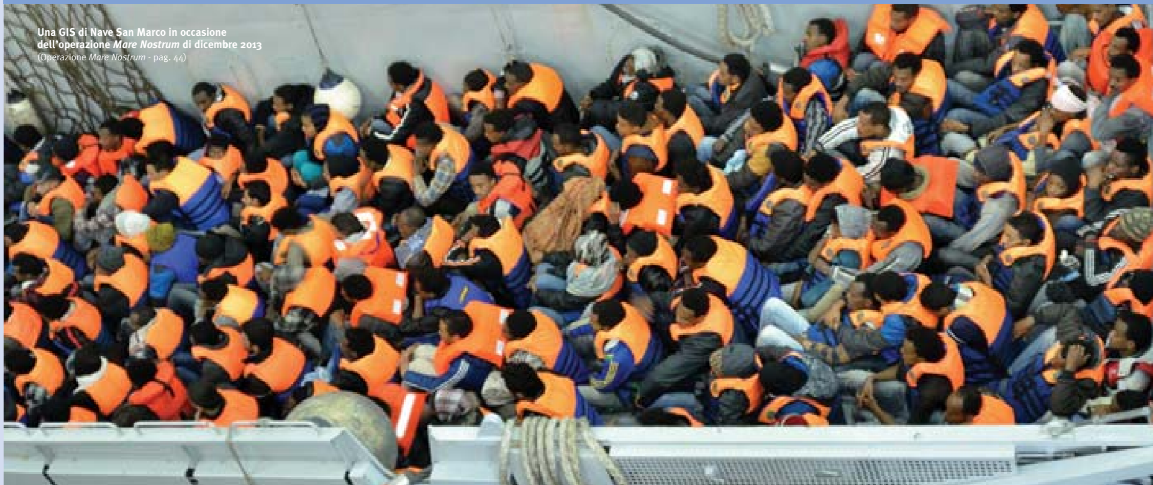
Una GIS di Nave San Marco in occasione dell'operazione Mare Nostrum di dicembre 2013 (Operazione Mare Nostrum - pag. 44)