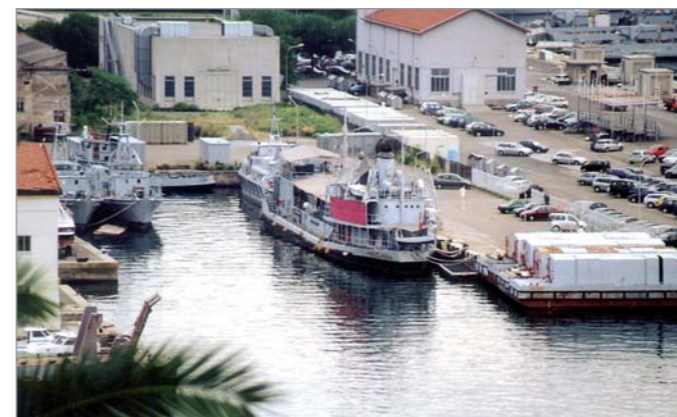
Il M.O.C. 1204, anch'esso mantenuto in servizio per un lunghissimo periodo (1950-2009), all'ormeggio a settembre del 2000 nella zona riservata ai mezzi di GRUPNUL nell'Arsenale della Spezia, a ridosso della Banchina Scali