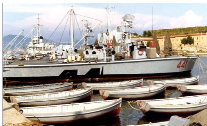
1968: l'ex motosilurante MS 441 , impiegata dagli incursori di Comsubin (dopo essere stata sottoposta a estese modifiche alla parte centro-poppiera dell'unità, con l'imbarco di due "selle" per alloggiare altrettanti mezzi subacquei). Si tratta di una motosilurante statunitense tipo "Higgins" di costruzione bellica, trasferita alla Royal Navy come MTB 422 e ceduta alla Marina italiana ad aprile del 1951. Inizialmente denominata GIS 841 , fu ridenominata MS 441 una volta decaduti i vincoli del trattato di pace che impedivano all'Italia il possesso di motosiluranti, venendo radiata nel 1985