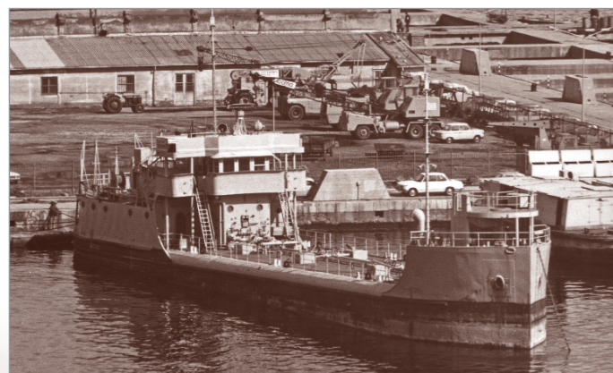
La Spezia, primi anni Settanta: la cisterna acqua Flegetonte , ex-statunitense YW-95 , acquistata nel 1948 e radiata nel 1974