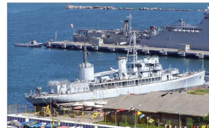
La nave appoggio incursori Pietro Cavezzale , radiata a marzo del 1994, in attesa della demolizione (aprile 2004) nella zona "Varicella" dell'Arsenale della Spezia. Si trattava ex- Oyster Bay (AVP-28), di costruzione statunitense, impostata nel 1942 come nave appoggio idrovolanti, entrata in servizio a novembre del 1943 come nave appoggio motosiluranti e ceduta all'Italia nel 1957. Per alcuni anni dopo la radiazione, il Cavezzale sarà impegnato come unità per l'addestramento statico degli incursori, all'ormeggio all'interno del seno del Varignano