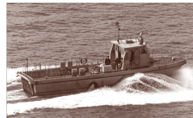
Il MEN 212 , un altro mezzo impiegato per il trasporto dei mezzi subacquei e altre attività di Comsubin, nel Golfo della Spezia il 28 aprile 1987