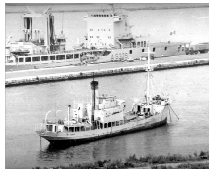
Un'altra "storica" ausiliaria della Marina italiana, in attesa della demolizione alla Spezia nel 1978. Si tratta della nave servizio fari Rampino , costruita in Germania nel 1922, acquisita dalla Regia Marina nel 1942 e radiata il 1° ottobre 1976