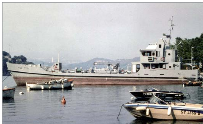
La piccola cisterna combustibili GGS 1012 , costruita dai cantieri Pellestrina di Venezia nel 1990-91 insieme ad altre tre similari unità ( GGS 1013 , '1014 e '1018). L'immagine è stata scattata nei pressi del Varignano nel 1991-92