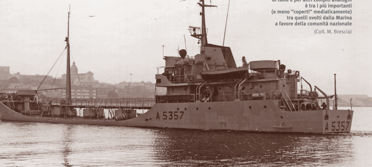
La cisterna acqua Bradano (1970-2004) nel 1975. Il ruolo di queste unità, spesso impiegate per il rifornimento idrico di isole e per altri compiti analoghi è tra i più importanti (e meno "coperti" mediaticamente) tra quelli svolti dalla Marina a favore della comunità nazionale