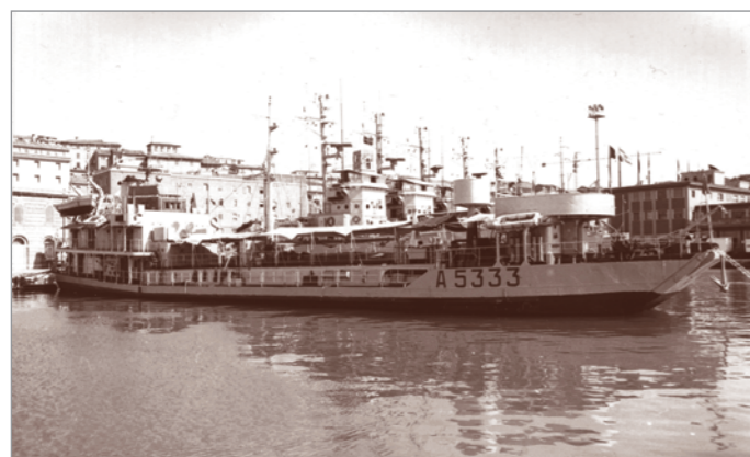
Tra le tante unità ausiliarie che - nel dopoguerra - hanno scritto oscure, ma faticose pagine di storia della Marina Militare non vanno dimenticati gli onnipresenti "M.O.C." (Moto Officine Costiere). In questa foto della seconda metà degli anni Sessanta è raffigurato il M.O.C. 1203 , un ex-LCT (mezzo da sbarco carri armati) britannico di costruzione bellica, poi mercantile Sandalia e infine acquisito nel 1950 dalla Marina Italiana che, con svariati compiti, lo utilizzò sino alla radiazione, avvenuta nel solamente nel 1998