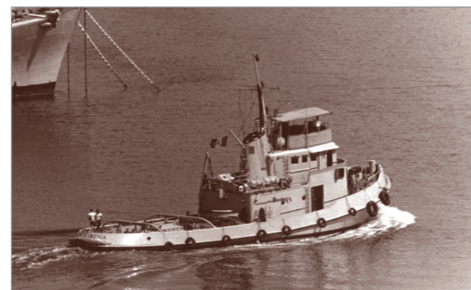
Il rimorchiatore costiero Porto d'Ischia in manovra nell'Arsenale della Spezia nel 1971. Costruito nel 1968-69 dai Cantieri Navali Riuniti del Tirreno di Riva Trigoso, verrà radiato a ottobre del 2002