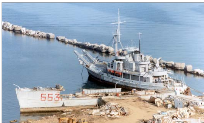
La Spezia, 18 marzo 1993. La nave posareti Alicudi (1955-1991) in attesa della demolizione; in primo piano, lo scafo del dragamine Agave la cui demolizione è invece quasi completata. L' Alicudi e la gemella Filcudi hanno costituito una delle "coppie" più note ed ubiqua tra le unità ausiliarie della Marina Militare Italiana a cavallo tra gli anni Sessanta e gli anni Ottanta