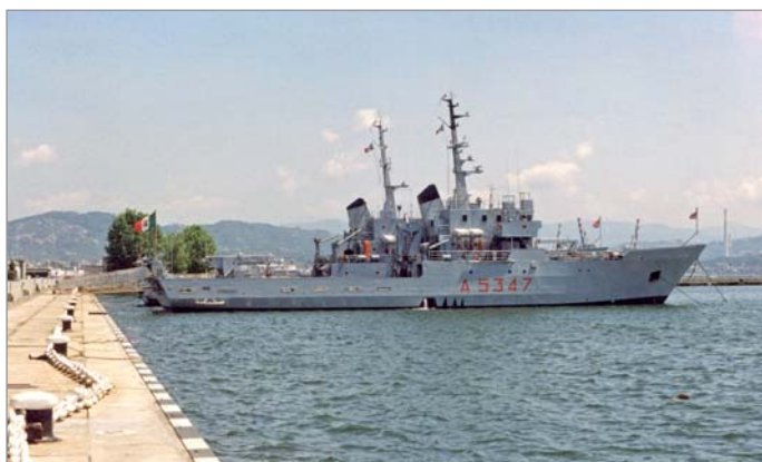
Arsenale della Spezia, Banchina Scali, 5 luglio 1996: il mototrasporto costiero Gorgona all'ormeggio insieme ad un'altra unità della classe