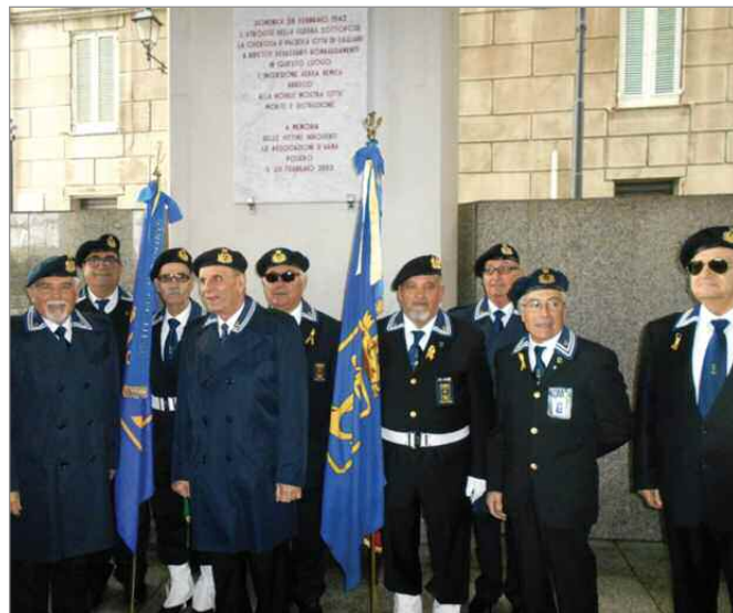
14 marzo. Il Gruppo ha partecipato al Precetto Pasquale Interforze, tenutosi nel Santuario di Nostra Signora di Bonaria.