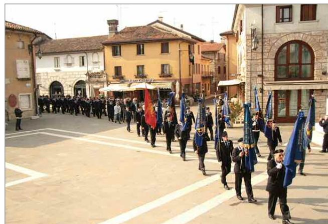
Il defilamento per le vie cittadine