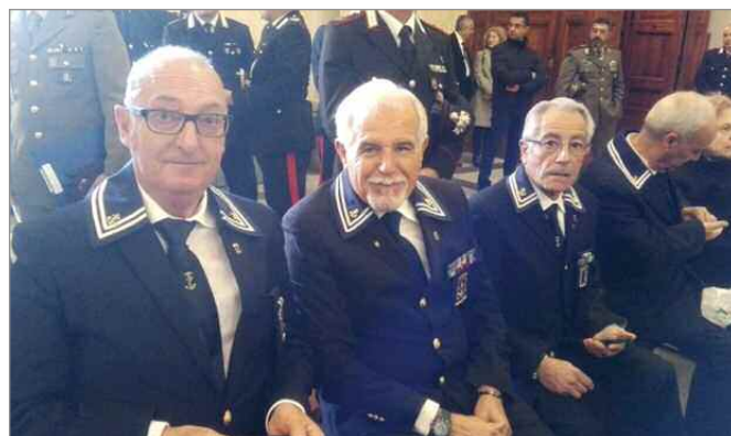
18 aprile. La delegazione del Gruppo era presente alla processione in onore di N.S. Maria Chiara nel Comune di Pirri (CA).