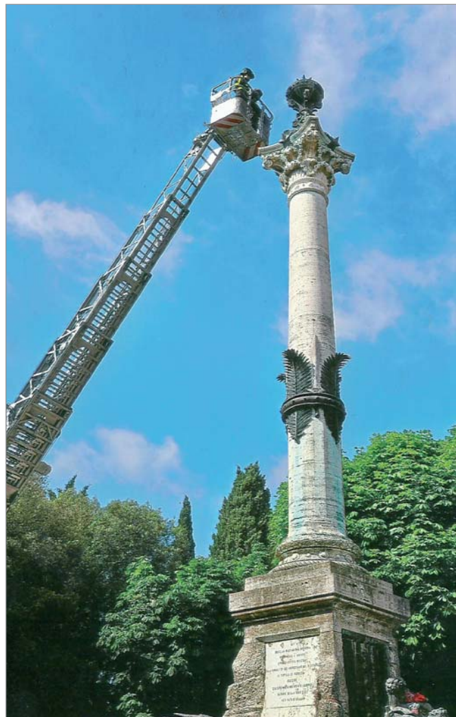
I Vigili del Fuoco posizionano la corona al vertice della Colonna

20 giugno. Cerimonia in Borgo XX Giugno presso la Colonna che ricorda la cacciata delle truppe papaline dalla città nell'anno 1859 e l'entrata delle truppe alleate nell'anno 1944.