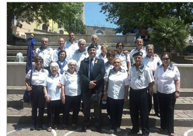
Il Gruppo di Salerno