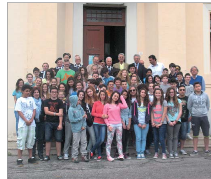
Foto di gruppo davanti alla Scuola