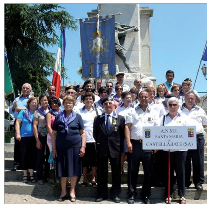
Il Gruppo di Santa Maria di Castellabate