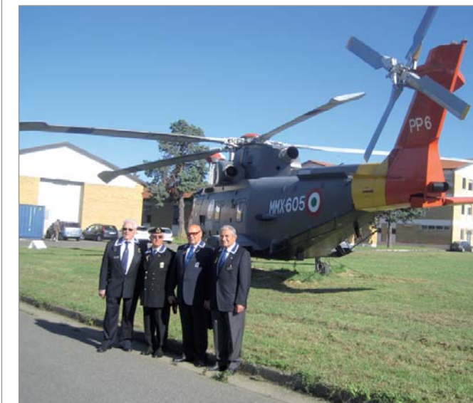
In visita alla Base Elicotteristica di Luni