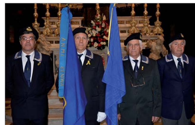
Bandiere dei Gruppi ANMI presenti (Savona a dx, Genova a sx) sull'altare durante la celebrazione in Cattedrale

7 maggio. La rappresentanza del Gruppo ha partecipato a Genova alla Messa di Suffragio in ricordo delle vittime della tragedia del Molo Giano, celebrata nella Cattedrale di San Lorenzo dal Cardinal Bagnasco alla presenza del CSMM amm. sq. De Giorgi e del Comandante Generale del Corpo delle Capitanerie amm. isp. capo Angrisano.