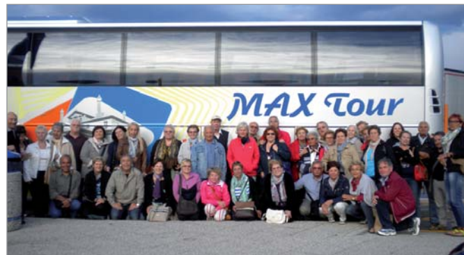
Gita sociale a Barcellona (Spagna)