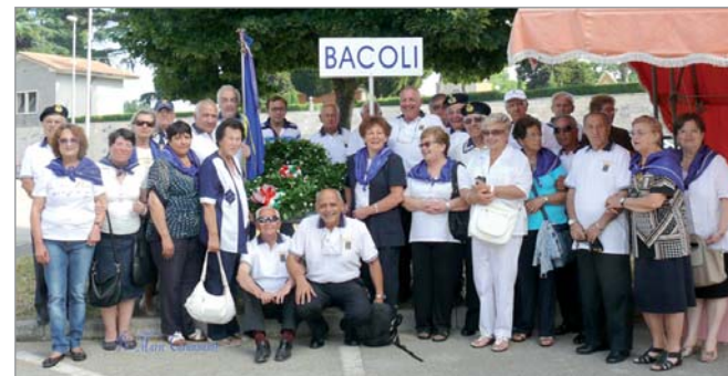
Il Gruppo di Bacoli

I Gruppi di Bacoli, Santa Maria di Castellabate e Salerno hanno inviato foto della loro partecipazione.