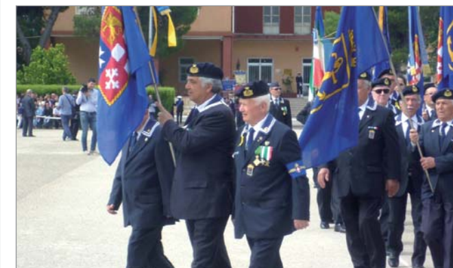
Defilamento dei vessilli e Gruppi della Puglia centrale e meridionale