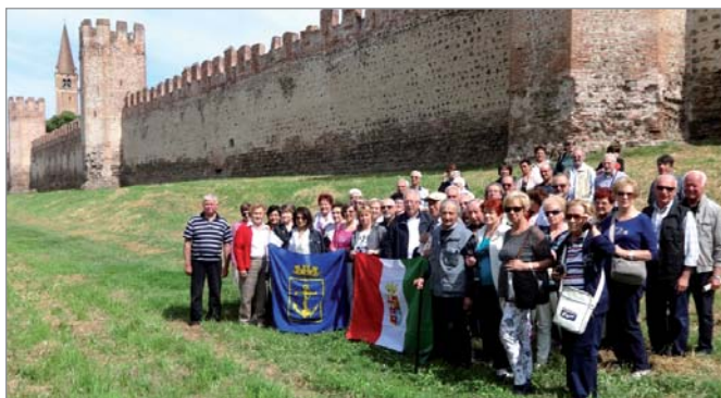
I partecipanti davanti alle mura della città di Montagnana

1 giugno. Il Gruppo ha effettuato la gita sociale di primavera in Veneto, visitando le città fortificate di Montagnana ed Este nel padovano.