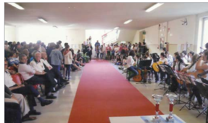
In attesa della premiazione