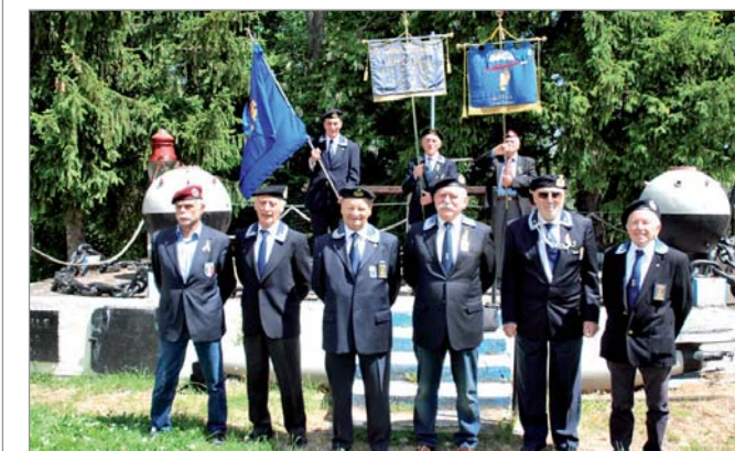
Davanti l'altare della Marina Militare