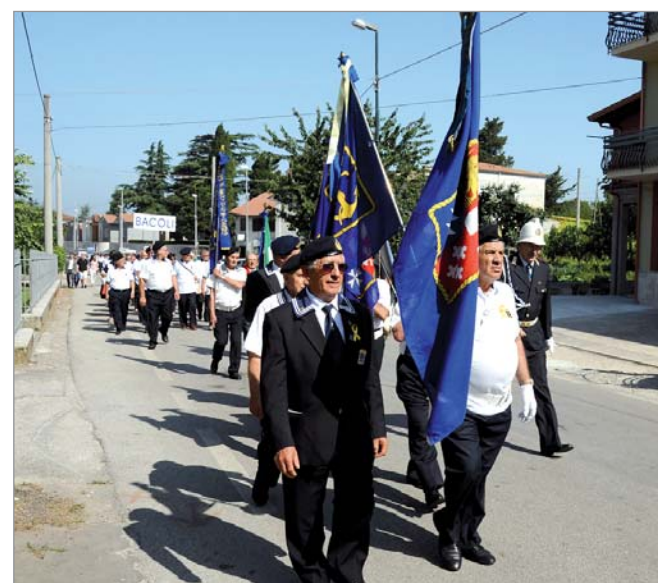
Durante il defilamento: in primo piano i soci di Santa Maria di Castellabate