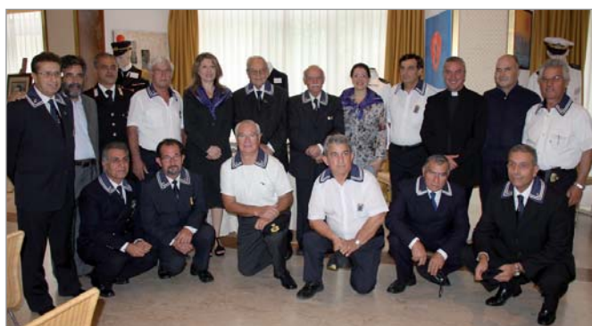
Il Gruppo in occasione dell'inaugurazione della mostra dei Cimeli e Divise Storiche della Marina