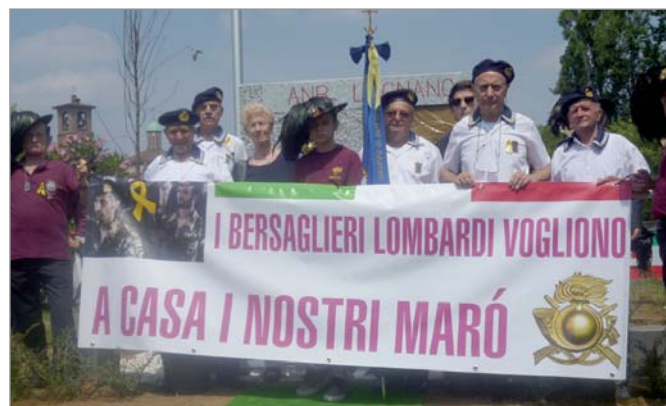
Lo striscione dei Bersaglieri per ricordare i nostri Fucilieri trattenuti illegalmente in India

Su invito di Assoarma Legnano i soci hanno partecipato all'inaugurazione del monumento al Bersagliere.