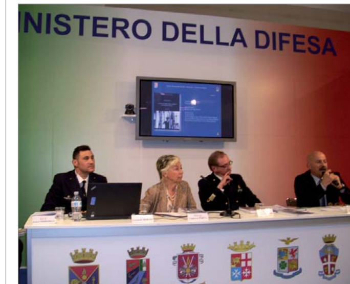
Una immagine della manifestazione fieristica

8-11 maggio. In occasione della Fiera del Libro, il CV Allegrini dell'USMM, accompagnato dal CF Merlini, al termine della manifestazione fieristica si è recato presso la sede del Gruppo ed ha visitato il Smg. Provana. Il Comandante sommozzatore si è ritrovato all'interno della camera di manovra del battello della prima guerra mondiale, ha espresso la sua sincera ammirazione per questo cimelio, testimone dell'amore per il mare della città e dei marinai di Torino.