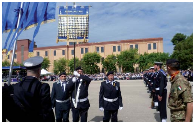
Il medagliere dell'Associazione Nazionale scortato dai soci di Taranto