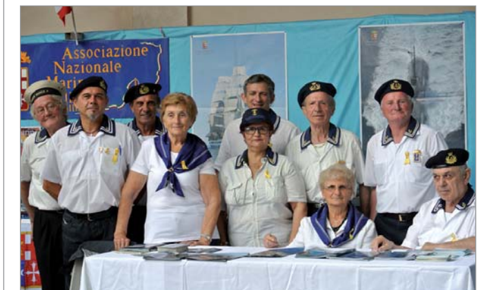
La rappresentanza del Gruppo presso lo stand allestito per la manifestazione

29 giugno. Contemporaneamente alla manifestazione interforze svoltasi nel Quadrilatero del castello Sforzesco, il Gruppo ha festeggiato il 55° anniversario di fondazione.