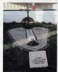
Al cimitero, il monumento

Penne nere, artiglieri e marinai hanno restaurato l'opera che ricorda i Caduti