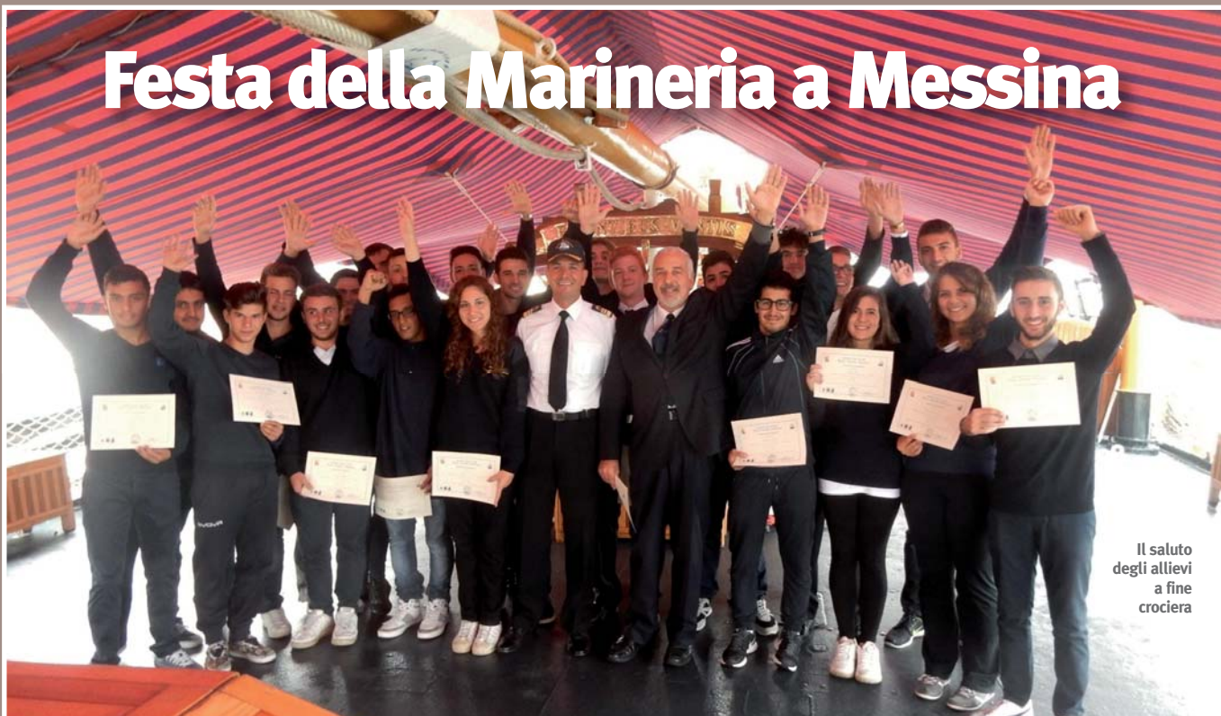
Il saluto degli allievi a fine crociera

7-11 ottobre 2015. Nave Palinuro , con a bordo i giovani soci ANMI, Lega Navale e Sta-Italia ha effettuato una sosta di rappresentanza presso la base navale della Marina Militare a Messina. Nell'ambito delle manifestazioni organizzate dal Comando Marittimo di Sicilia presso il Comando Supporto Logistico MM, il giorno 10 ottobre si è svolta, a bordo della Nave, una conferenza per i giovani velisti a cura dell'amm. sq. Giovanni Iannucci. L'Ammiraglio, già Comandante di Nave Vespucci e Marisicilia, ha raccontato e rievocato le sue esperienze di regate oceaniche a bordo dei velieri Corsaro II e Stella Polare . Presenti alla conferenza il Comandante di Marisicilia