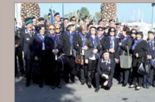
Foto ricordo di alcuni Gruppi ANMI che hanno partecipato alla cerimonia