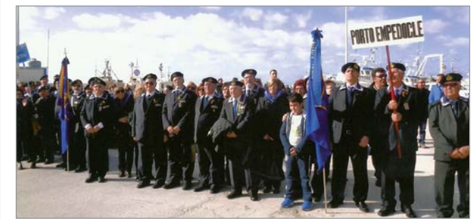
Foto ricordo del Gruppo di Porto Empedocle