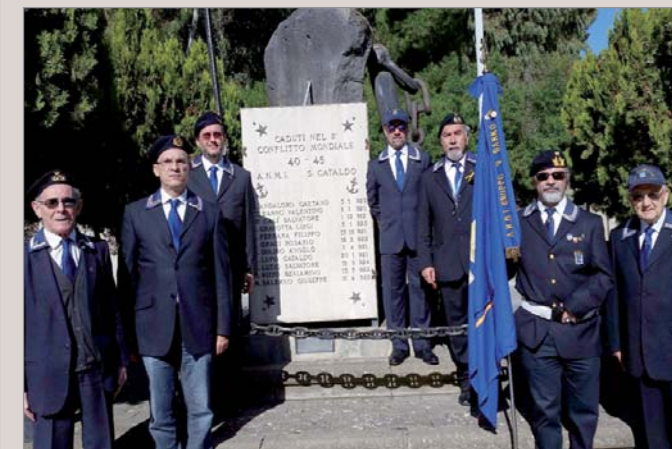
La rappresentanza dei soci al monumento ai Caduti