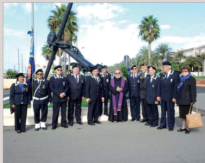
Cerimonia e deposizione della corona di alloro al monumento ai Caduti del mare a cura del Gruppo