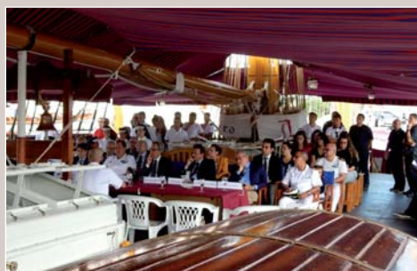
A bordo per la conferenza