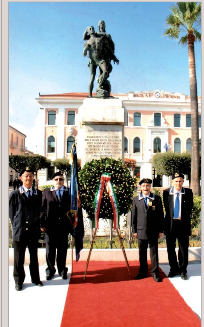
Deposizione della corona al monumento in ricordo dei Caduti in piazza Monumento