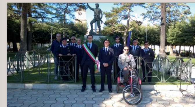
Una rappresentanza del Gruppo con il Sindaco di Bernalda