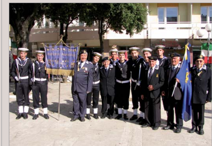
Al monumento ai Caduti in piazza Garibaldi