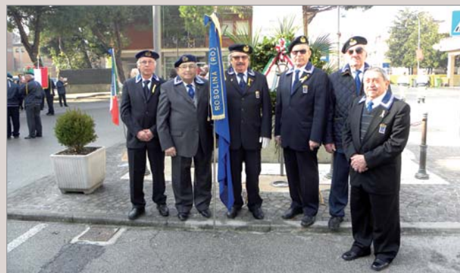
Alla manifestazione in piazza Marinai d'Italia