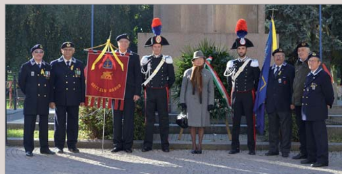
Al monumento ai Caduti in occasione della cerimonia