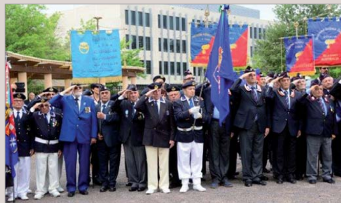
Durante la cerimonia