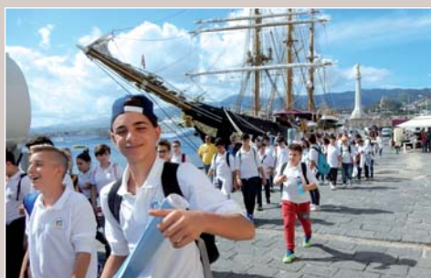
Visite da parte delle scolaresche