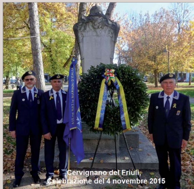
Cervignano del Friuli, Celebrazione del 4 novembre 2015

per noi Marinai un grande valore sia essa manifestata nei poco noti sacelli di Aiello, Joannis e Cervignano del Friuli o al più prestigioso Sacario Militare di Redipuglia.