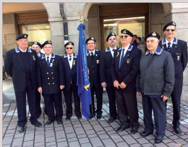
La rappresentanza del Gruppo durante la cerimonia in città

Una delegazione di soci, insieme a tutte le Associazioni d'arma del territorio, ha partecipato alla cerimonia presso Vinovo (TO), con un pensiero speciale a quanti hanno perso la vita durante la seconda guerra mondiale.