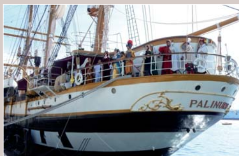
La Compagnia Rinascimentale della Stella di Messina