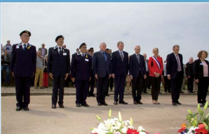
Deposizione di cuscini di fiori ai piedi del monumento, in presenza del Console italiano