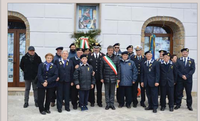
Presenti alla cerimonia organizzata dal Comune di Castellabate nella Frazione San Marco