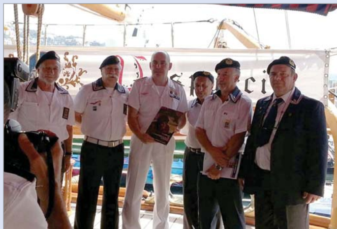
Il Gruppo di Sarzana a bordo.