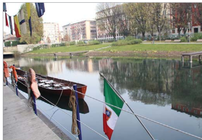
I Giardini Fogar fronte sede Marinal d'Italia