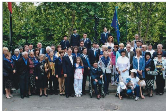
Foto ricordo del Gruppo che ha festeggiato l'anniversario di costituzione