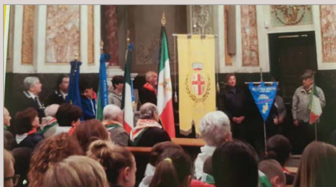
Durante la Messa in ricordo dei Caduti nella chiesa di Taggia