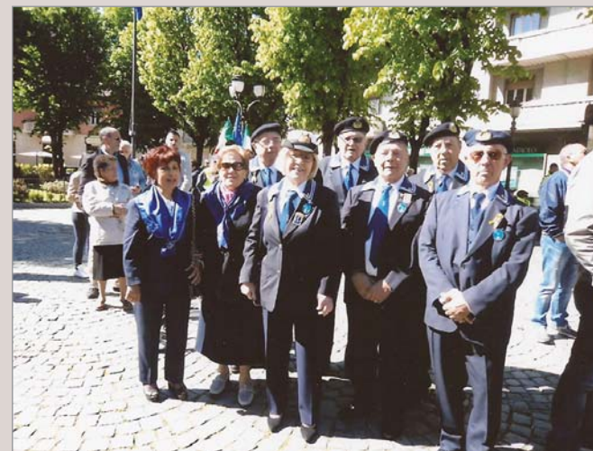
La rappresentanza del Gruppo che ha partecipato alla cerimonia organizzata dal Comune