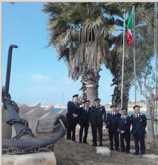
La delegazione del Gruppo dopo la commemorazione avvenuta presso il monumento locale dei Caduti del mare