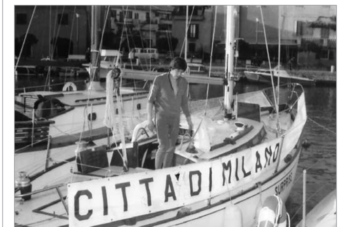
Ambrogio Fogar sul Surprise

Oggi la zona della Darsena è tornata ad essere uno dei luoghi più frequentati di Milano. Qui, nel corso dell'anno, si svolgono eventi e manifestazioni che spesso coinvolgono decine di migliaia di persone. In occasione del "NavigaMI", il Salone Nautico di Milano, ad ingresso gratuito, che si è tenuto proprio in Darsena dal 13 al 15 maggio, il Gruppo ha allestito una mostra di modellismo navale e altre attività, compresa una dimostrazione di cani da salvataggio.