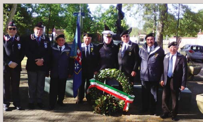
Il Gruppo subito prima di depositare la gerba sul monumento ai marinai caduti di Collegno