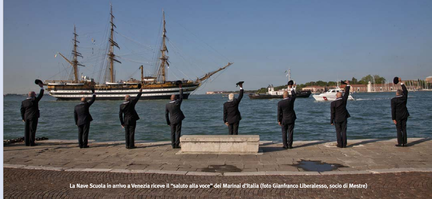
La Nave Scuola in arrivo a Venezia riceve il "saluto alla voce" dei Marinai d'Italia

al comando del capitano di vascello Curzio Pacifici, ha mollato gli ormeggi il 27 aprile da La Spezia, dopo oltre 2 anni di sosta per importanti lavori di manutenzione e in occasione del suo 85° anniversario. A bordo oltre 300 persone, non solo membri dell'equipaggio, ma anche giovani militari in ferma prefissata e un gruppo di boy scout.