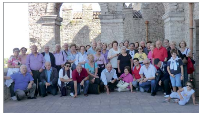
I partecipanti sulla terrazza-belvedere del castello medioevale

18 ottobre 2014. Gita sociale a Caccamo, ridente cittadina in provincia di Palermo.