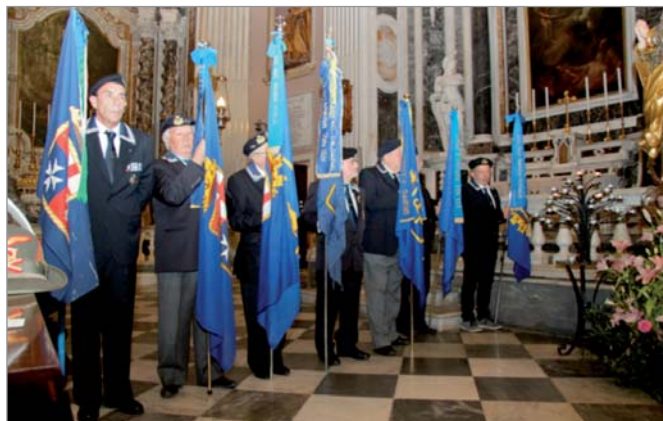
I vessilli dei Gruppi ANMI della provincia di Imperia presenti alla cerimonia

Numerose le autorità che hanno partecipato alla celebrazione: il Prefetto, il Sindaco, il Presidente Provincia, il Procuratore della Repubblica, il Questore, il Comandante Provinciale Carabinieri, il Comandante Provinciale GG.FF., il Comandante Provinciale VV.FF., il Comandante Provinciale Guardia Forestale, il Comandante Capitaneria di Porto, i Sindaci dei Comuni costieri.