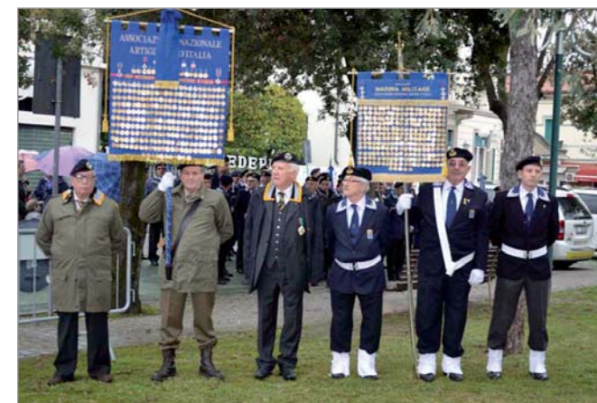
I Medaglieri schierati al monumento al marinaio