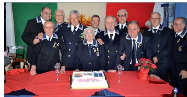
Alcuni dei soci partecipanti al pranzo sociale