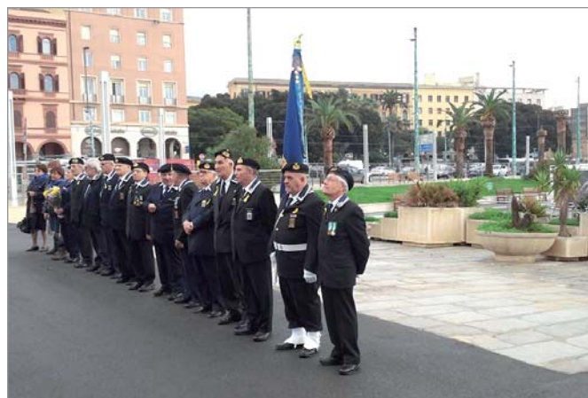
L'alzabandiera presso il monumento ai Caduti

Il Gruppo ha festeggiato con i soci di San Gavino Monreale .