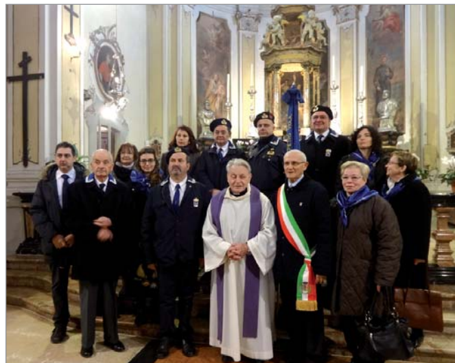
Presso il Santuario di Santa Croce a Torricella Verzate (PV)