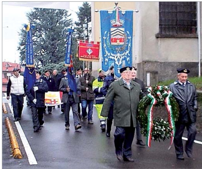
I marinai della sezione aggregata di Solbiate Arno mentre defilano con il gonfalone del Comune e il Sindaco per raggiungere il monumento ai Caduti del mare