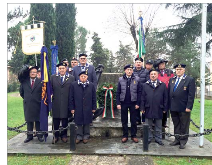
I marinai del Gruppo davanti al monumento ai Caduti del mare