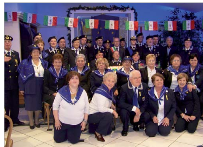
Il Direttivo con il Vicesindaco e il Guardiamarina