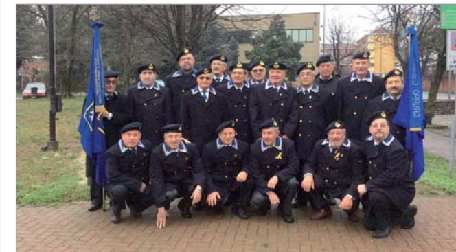
Davanti al monumento di Beinasco, nei pressi della sezione di Borgaretto, aggregata al Gruppo di Carmagnola