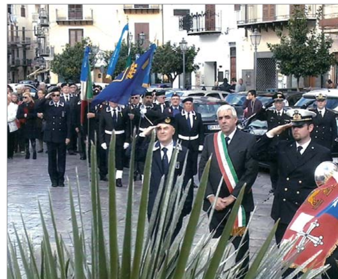
Sosta al monumento ai Caduti