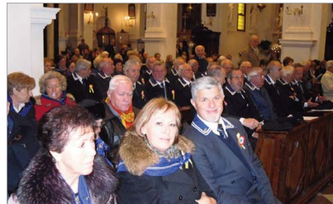
I due Gruppi in chiesa per la festa della Santa Barbara