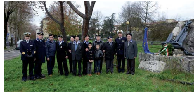
Davanti al monumento ai Caduti del mare