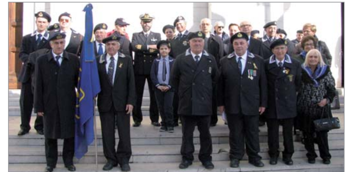
Foto ricordo in occasione della Festa