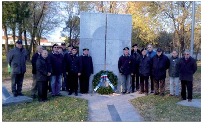
I soci del Gruppo subito dopo la deposizione della corona d'alloro al monumento ai Caduti del mare