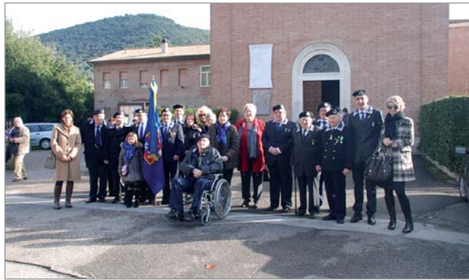
La rappresentanza dei soci che ha partecipato alla Messa e al successivo pranzo sociale