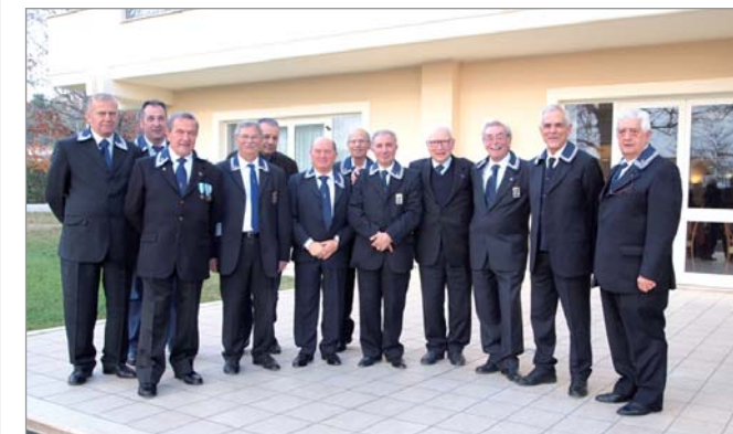
I marinai del Gruppo in una foto ricordo della giornata