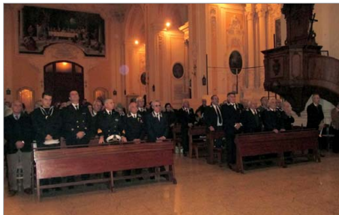
Durante la celebrazione della Messa