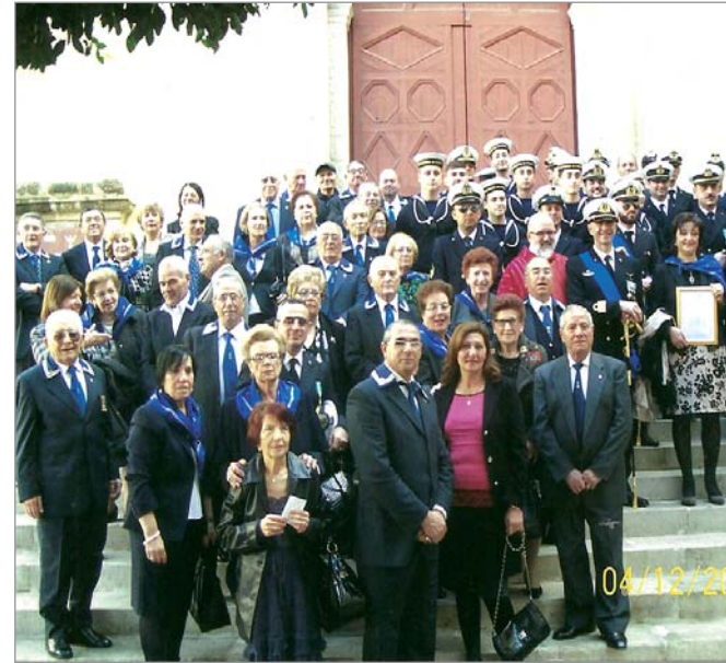
Foto ricordo dopo la Messa