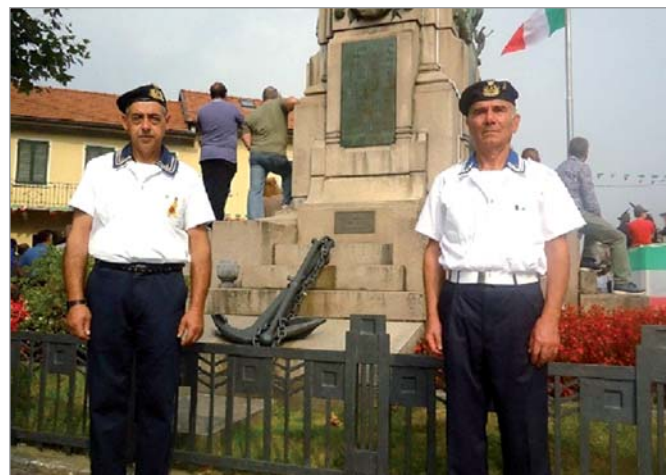
I due soci che hanno reso gli onori al monumento al marinaio

28 settembre 2014. Partecipazione di alcuni soci del Gruppo al 1° Raduno Alpini di Aosta-Piemonte e Liguria, tenutosi ad Omegna (VB).