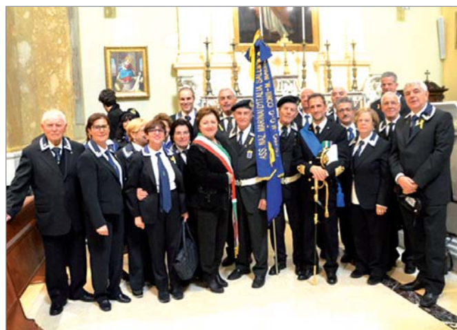
Dopo la deposizione della corona d'alloro al monumento dei marinai