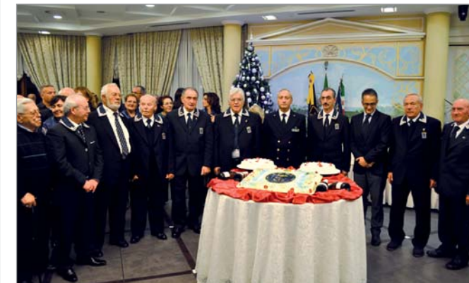
Foto ricordo in occasione del pranzo sociale