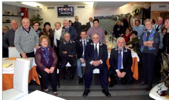
I soci al pranzo organizzato per la ricorrenza