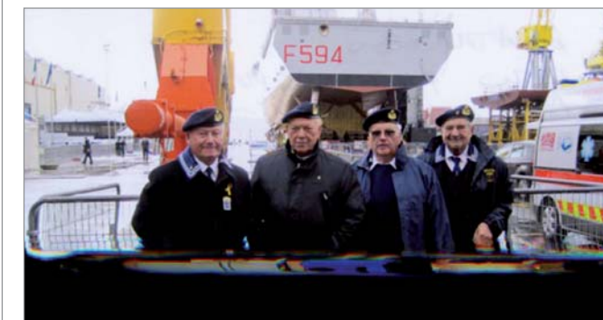
La delegazione del Gruppo presente al varo