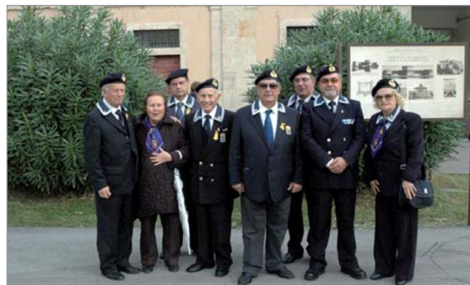
I soci di Ladispoli