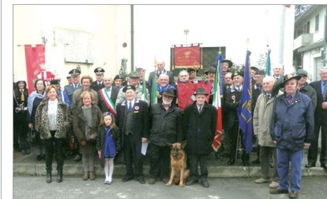
Foto ricordo in occasione della cerimonia