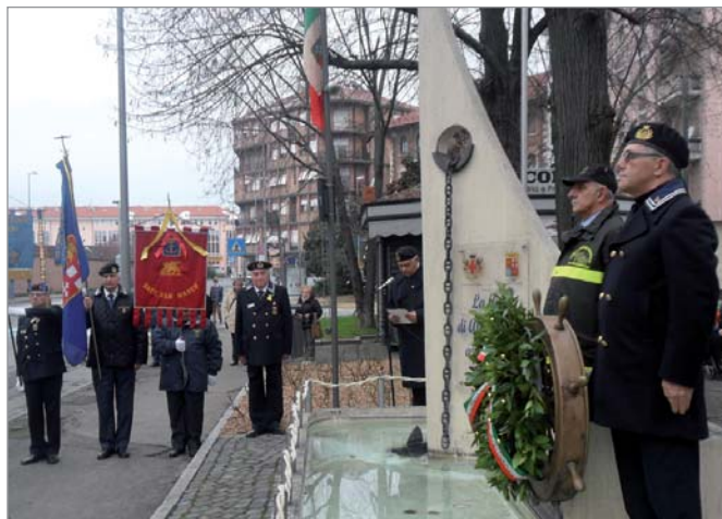
La cerimonia al monumento ai Marinai d'Italia