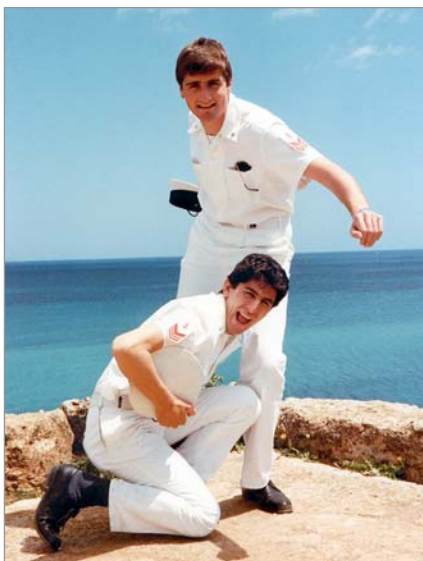
"Come eravamo" in Algeria nel maggio 1984