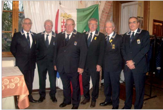
Il Consiglio Direttivo del Gruppo