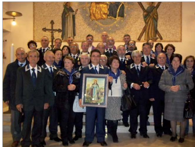
Il presidente insieme ad una ventina di soci del Gruppo con consorti, hanno festeggiato prima celebrando una Messa in onore della patrona e poi partecipando ad una cena sociale