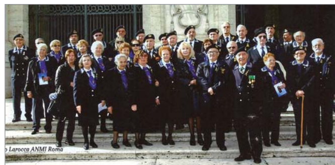
Consiglieri e Comitato Patronesse davanti alla Basilica di San Giovanni dopo la Messa