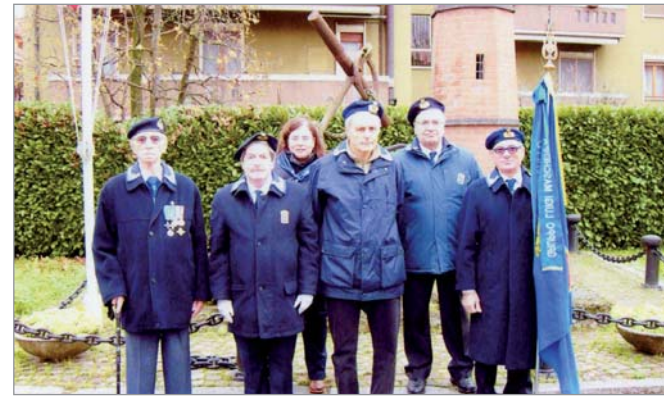
Alcuni soci partecipanti alla ricorrenza