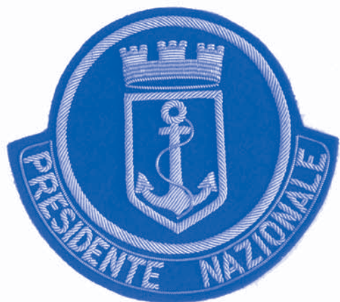
Presidente Onorario Nazionale