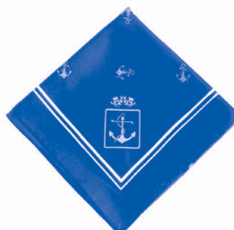
Fazzoletto (lato cm. 77)