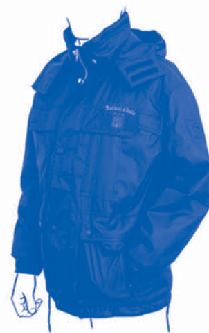
Giacca a vento