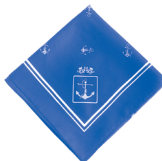
Fazzoletto (lato cm. 77)