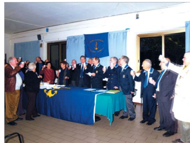
È il momento del cin-cin augurale