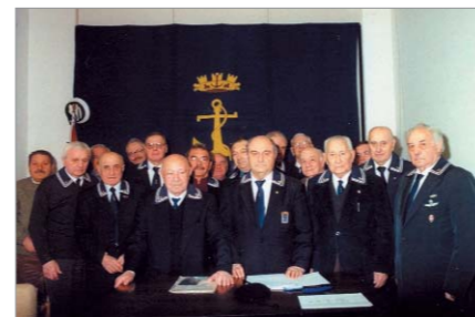
Sabato 27 febbraio: Assemblea Ordinaria annuale dei Soci del Gruppo "Gianni Genta"