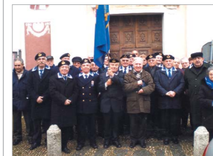
Foto ricordo al termine della S.Messa in suffragio dei Caduti del Mare e dei Soci defunti, in occasione della ricorrenza di Santa Barbara. È seguito il tradizionale pranzo sociale