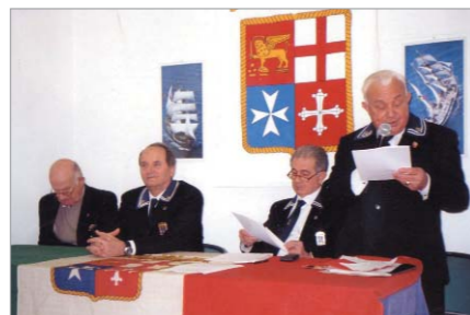
Il tavolo della presidenza