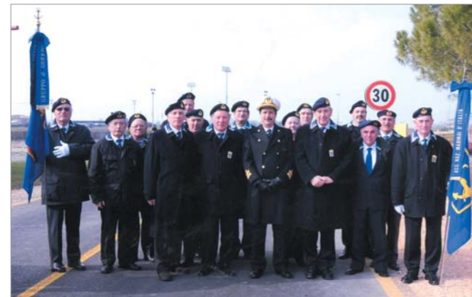
L'Ammiraglio Di Cecco ripreso con la rappresentanza ANMI intervenuta alla cerimonia

Fasi salienti della cerimonia; S. Messa in Duomo officiata da Mons. Piersante Dametto; alza Bandiera in Piazza Grande; corteo aperto dalla Banda dei Bersaglieri; scoprimento della Targa di Intitolazione della Via da parte della consorte del Caduto accompagnata dalla figlia; allocuzioni di circostanza.