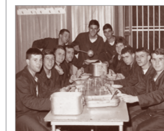
A Maridepocar La Spezia