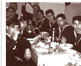
Santa Barbara 1968 a Comsubin (Varignano SP)