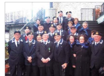
Delegazioni dei Gruppi "G.M. (AN) Rosario Cocuccio" (Bacoli) e "CGVM Tonino Schiano" (Monte di Procida), intervenuti domenica 31 gennaio al concerto inaugurale dell'Auditorium di Ravello, diretto dal Maestro Salvatore Accardo