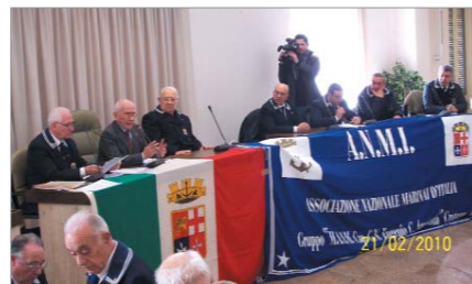
Particolare durante le operazioni di voto

Al termine dell'Assemblea sono seguite le operazioni di voto per l'elezione del nuovo Consiglio Direttivo e Collegio dei Sindaci e del rappresentante dei Soci ordinari, aggregati e aderenti.