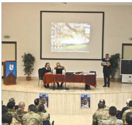
Un altro particolare momento