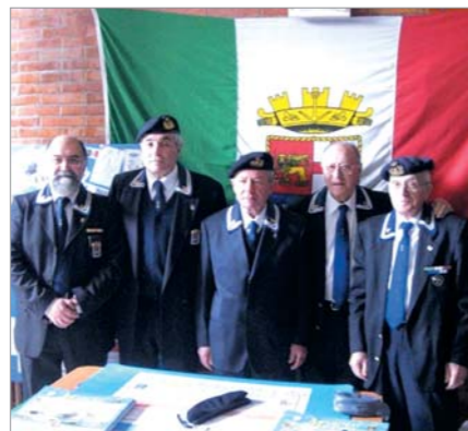
Un turno di Soci addetti allo stand per fornire spiegazioni sul materiale esposto, sorveglianza e distribuzione di materiale promozionale

state distribuite anche decine di calendari editi dal Gruppo soprattutto ai giovani visitatori studenti delle Scuole.