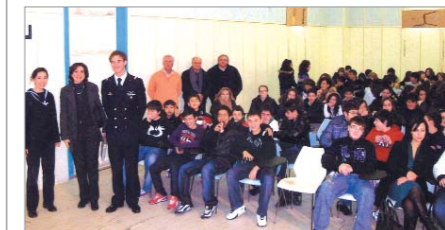
Parziale panoramica della sala convegni del Plesso A. De Gasperi durante le lezioni