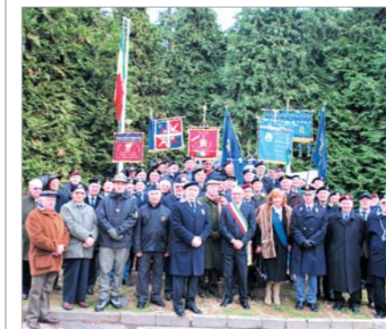
Al termine della cerimonia al monumento ai Caduti del Mare organizzata dal Gruppo "MOVM Carlo Fecia di Cossato" in occasione della S. Barbara 2009, preceduta dalla S. Messa nella Basilica di S. Sebastiano - intervenute autorità civili e militari, rappresentanze dell'Istituto del Nastro Azzurro, di Associazioni d'Arma e Veteran dello sport, dell'unuci.

È seguito il tradizionale pranzo sociale