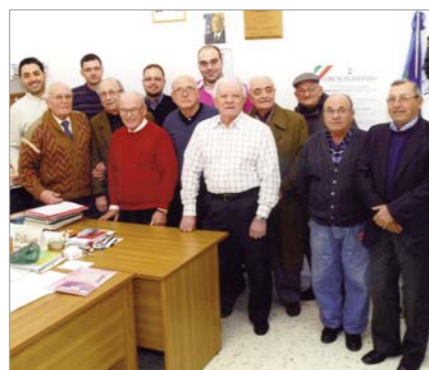
Foto "informale" dei nuovi Consiglio Direttivo e Collegio Dei Sindaci del Gruppo "MAVM Pietro Zaccaria"