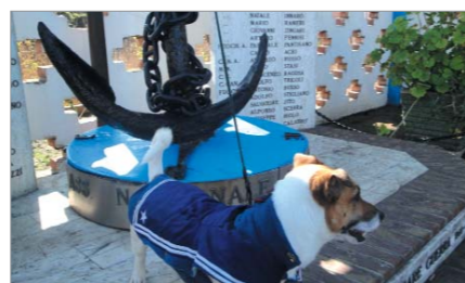
"Jeak" della razza Jeak Russell, la mascotte del Gruppo