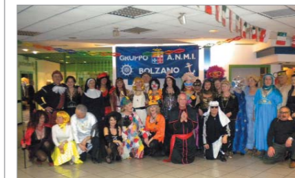
Alcuni dei numerosi partecipanti, Soci, familiari, simpatizzanti, ospiti al tradizionale Ballo di Carnevale dei Marinai, organizzato dal Gruppo "T.V. Antonio Bonelli"