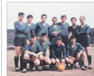
Squadra di Calcio Logistica Varignano