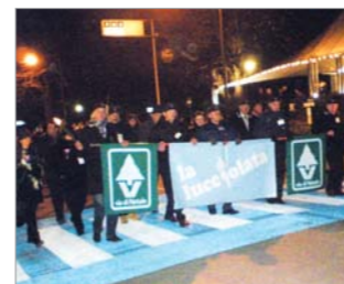
Partenza della Lucciolata da Piazza del Popolo