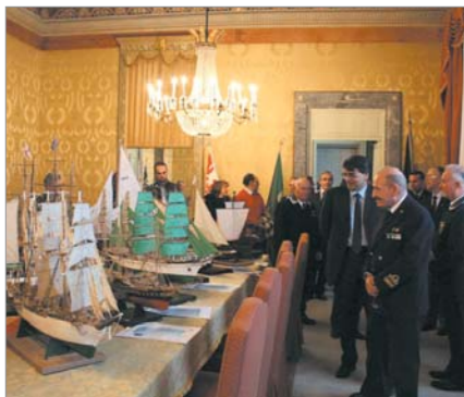
Parziale panoramica della mostra, in primo piano l'Ammiraglio Talarico

La mostra, rimasta aperta fino al 31 gennaio, ha ottenuto grande successo come dimostrato dal gran numero di visitatori.