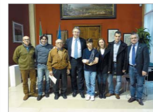
Palazzo del Municipio: il ragazzo aggredito (con un braccio ingessato) i suoi genitori, il Sindaco, gli Assessori e il Socio Borghi

Per questo mercoledì 3 marzo è stato ricevuto dal Sindaco, Prof. Luca Ceriscioli, che, presenti anche gli Assessori alla Sicurezza ed alla Partecipazione, gli ha consegnato un riconoscimento al Valore Civico con la stima, la gratitudine e l'ammirazione dell'Amministrazione Comunale e dell'intera città per il gesto di coraggio, solidarietà umana, altruismo e senso civico dimostrato.