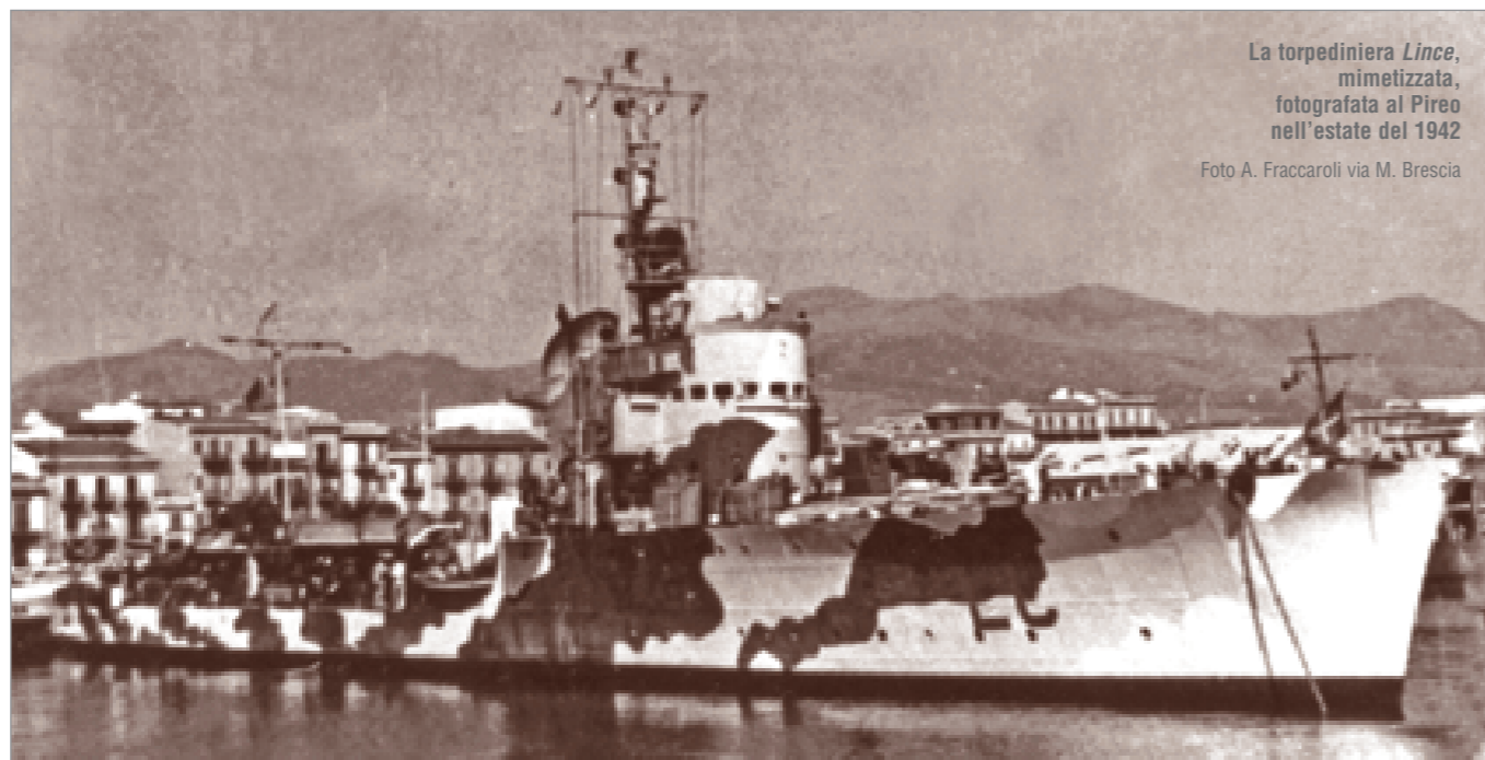
La torpediniera Lince , mimetizzata, fotografata al Pireo nell'estate del 1942