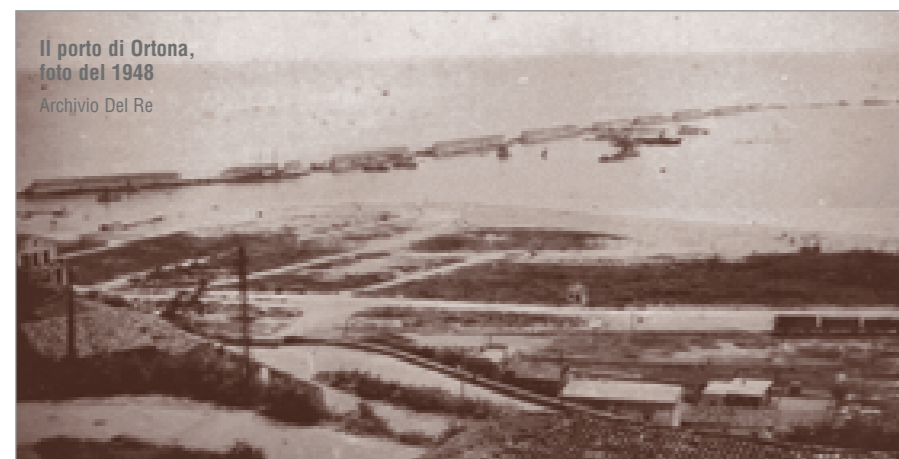
Il porto di Ortona, foto del 1948

Un racconto popolare riporta che dopo la fine della guerra un gruppetto di persone non meglio identificate visitò il porto di Ortona. Sebbene apparentemente forestieri davano l'impressione che erano alla ricerca di qualche cosa e sapevano dove andare. Si recarono nella piccola spiaggia alla radice nord del molo Martello e si misero a scavare nella sabbia. Trovato un fagotto, furono presi da una crescente smania nell'aprirlo, ma insoddisfazione e sconforto comparvero sui loro volti. Le loro sciabole d'ordinanza, a suo tempo sepolte nella spiaggia per non consegnarle al nemico, erano state ossidate dalla salsedine marina a tal punto che recuperarono soltanto l'else.