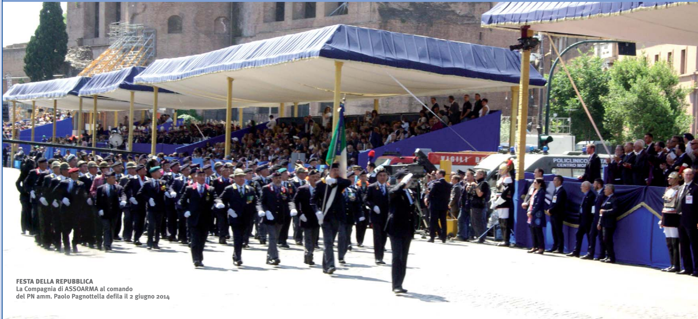
FESTA DELLA REPUBBLICA La Compagnia di ASSOARMA al comando del PN amm. Paolo Pagnottella defila il 2 giugno 2014

Il formato deve essere uno dei noti sistemi di videoscrittura (WORD, RTF, TEXT) evitando l'uso di macro, non impaginato e senza fotografie che vanno inviate a parte. Un apposito Comitato di Redazione, è incaricato di valutare l'idoneità alla pubblicazione degli elaborati e del materiale fotografico.