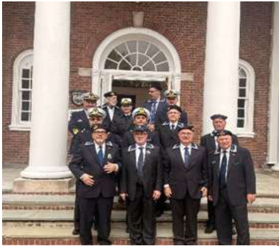
Rappresentanti dei Gruppi USA e personale in servizio intervenuto all'incontro ANMI USA

Amm. Giasone Piccioni, Capo di Stato Maggiore della Marina (1985-1988) con la seguente motivazione: "Con profonda gratitudine per aver